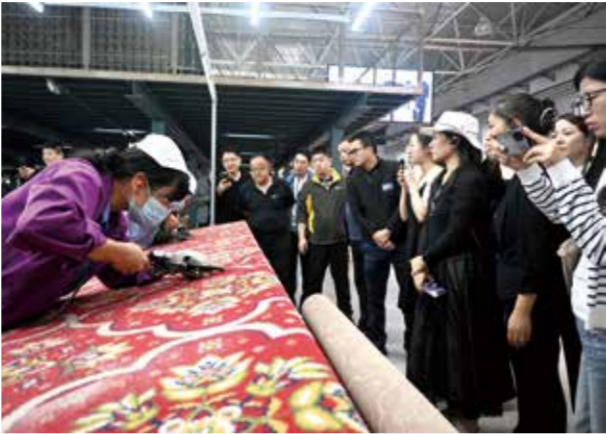
高训班学员在各企业深入学习、探访。