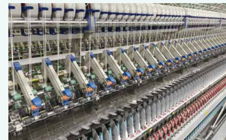
加快发展新质生产力是打造新竞争优势的必然选择。

他表示，联宏纺织近年来围绕“深耕主业，创新发展”的工作方针，不断加快传统产业转型升级的步伐，大力推进智改数转建设和产业链配套，并建立了高端纺织印染产业园和数字经济产业园两个园区。联宏在夯实传统主业的基础上，立足创新转型，大胆尝试，创办数字经济产业园，边学、边干、边闯，以直播电商、老虎工业云、跨境电商、“基金+产业”作为园区四大定位。依托抖音、快手等互联网平台，加盟亚马逊、Zalando 欧洲电商，全面入局直播带货领域，经过一