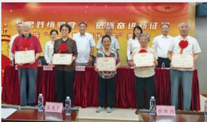
与会领导为老党员颁发荣誉证书。

6月27日，纺织离退休干部局召开以“学思践悟明党纪 砥砺奋进新征程”为主题的庆“七一”大会，热烈庆祝中国共产党成立103周年，为优秀共产党员、优秀党务工作者和先进党支部颁发荣誉证书，为党龄满50年的党员颁发了“光荣在党50年”纪念章。中国纺联原会长杜钰