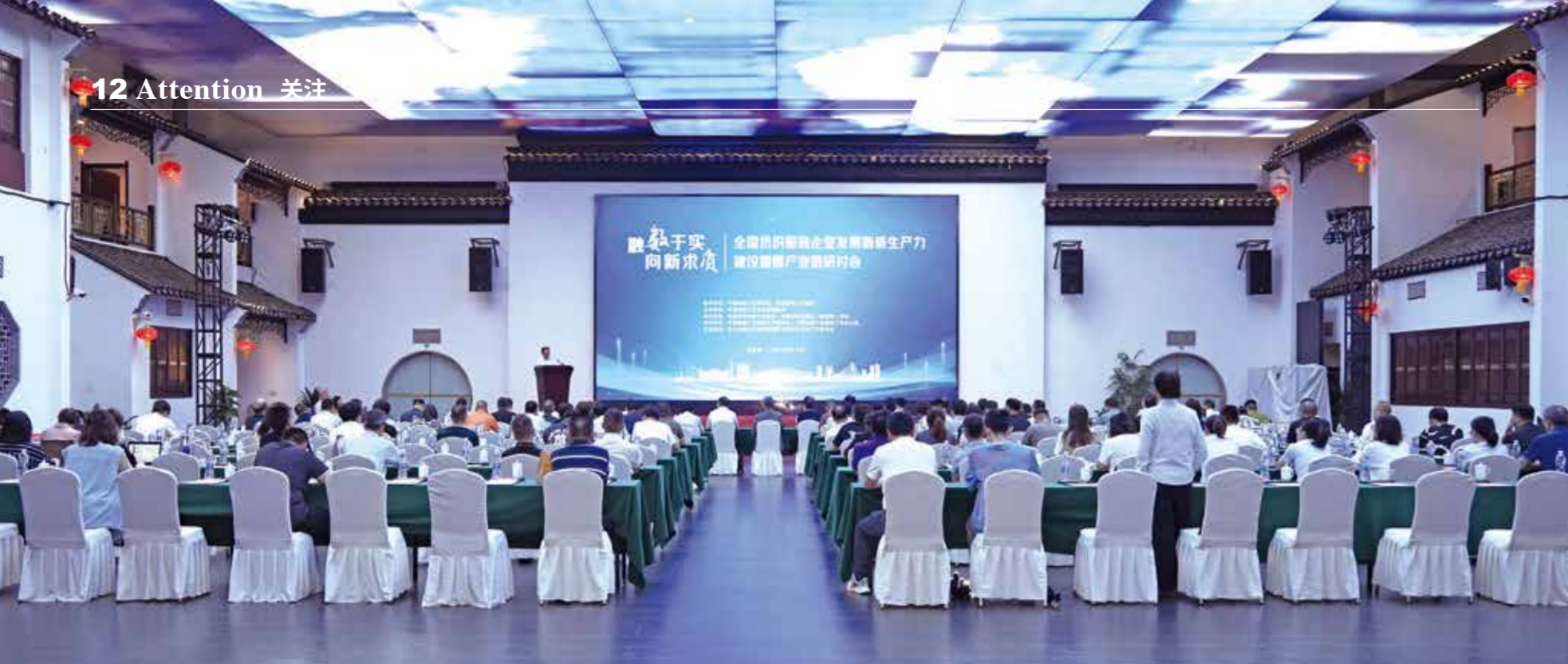
研讨会进一步助推产业数字化转型。