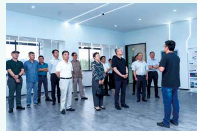
行业领导、企业家代表参观重点企业。

近年来，新一代信息技术加速创新，日益融入经济社会发展各领域全过程，数字经济发展速度之快、辐射范围之广、影响程度之深前所未有。为加快推进纺织产业数字化转型，构建与新质生产力相适应的数字基础，促进行业与数字经济深度融合，6月25日，以“融数于实，向新求质”为主题的全国纺织服装企业发展新质生产力、建设智慧产业链研讨会在江苏省张家港市举办。