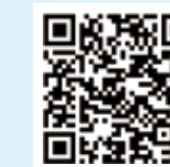
纺织服装周刊 网易号