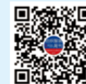
纺织服装周刊 微信视频号