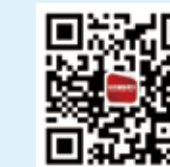
纺织服装周刊 新浪微博