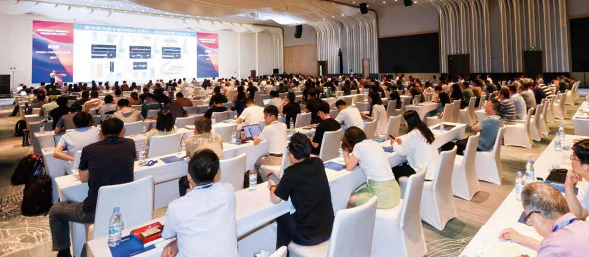
大会汇集众多专家为化纤行业未来发展答疑解惑。