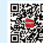
纺织服装周刊 今日头条号