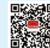
纺织机械 微信订阅号