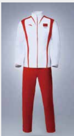
巴黎奥运会中国体育代表团领奖服。

2012年中国龙年，“龙”元素首次融入中国体育代表团领奖服设计，“中国龙”的足迹已遍布伦敦、索契、里约、平昌、东京和北京的奥运赛场。(辛雯)