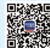
纺织服装周刊 微信订阅号