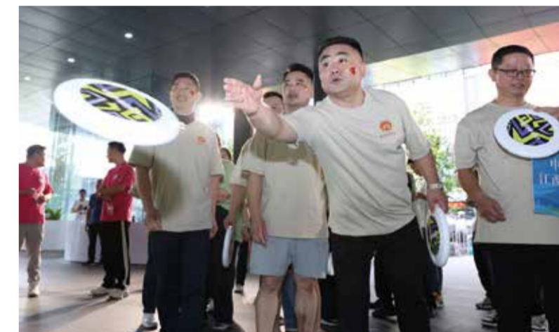
各项活动丰富多彩。