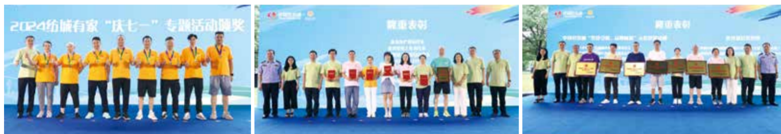
各基层党组织队伍在活动中奋勇争先。