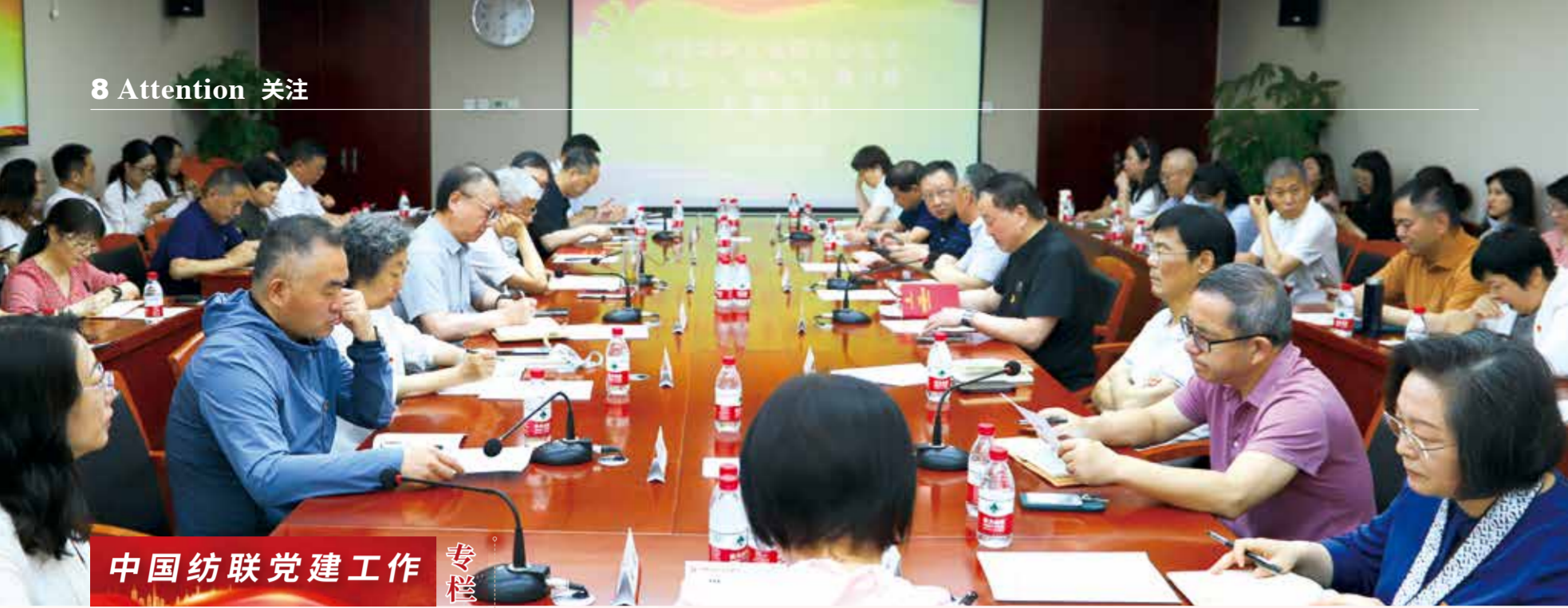
主题党日活动让所有党员深感使命在肩。