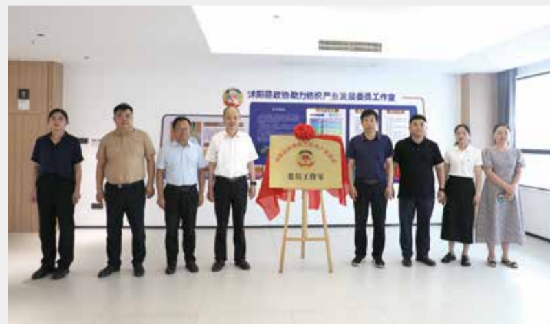
与会嘉宾为工作室揭牌。

近年来，沭阳县不断强化产业链思维，在补齐产业链中找项目，在延伸产业链中求突破，在建强产业链中谋增长，着力培育“拆不散、搬不走、压不垮”的千亿级产业集群。沭阳纺织产业今后还将全力夯实先进制造产业基础，持续提升集群化发展的质量效率，同时主动布局国际化的现代供应链体系。