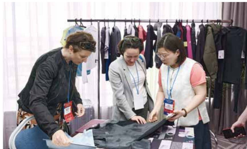
中俄纺织服装企业展开商贸洽谈。