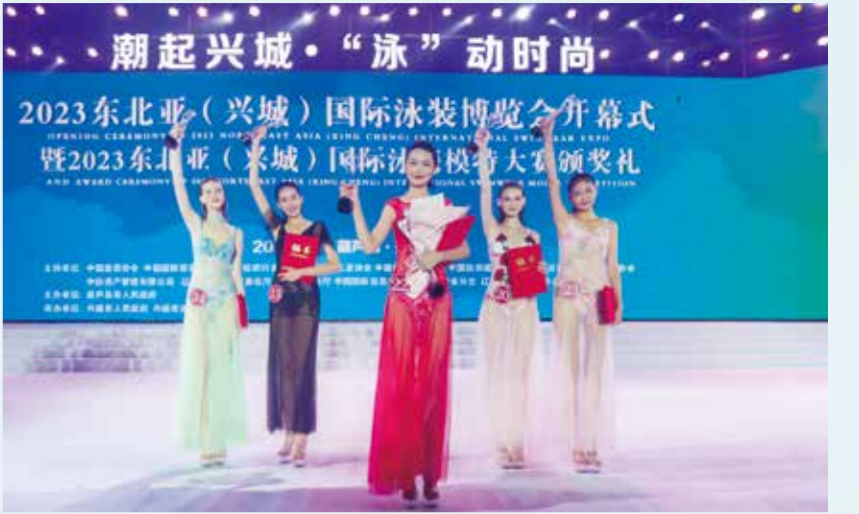
兴城泳装借助活动、赛事等积极推动产业交流与发展。

远，投向了“跨境电商”国际市场。2014年，东北首个跨境电商平台诞生。与此同时，斯达威的泳装海外仓投入使用，此举使泳装跨境物流时间缩短了87%，成本降低了40%，国际市场售后服务问题得以解决，产品竞争力显著增强，为推动和促进国家对外贸易的发展和兴城泳装产业的振兴做出了历史性贡献。