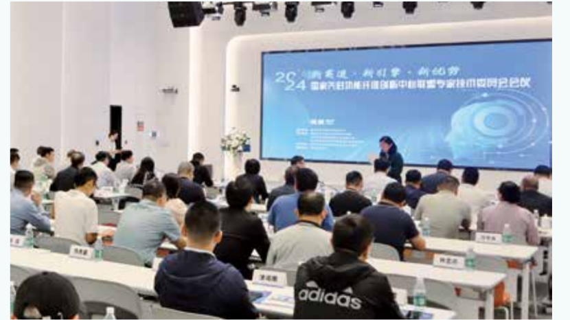
会议分享了产业链上下游领域科研成果、创新应用等最新信息。

作为一个跨行业、跨领域、打破技术局限性的创新型平台，旨在整合行业内的优质资源，实现全产业链的协同与高效运作。该平台以大连华纶无纺设备工程有限公司为坚实依托，提供共享试验平台、专