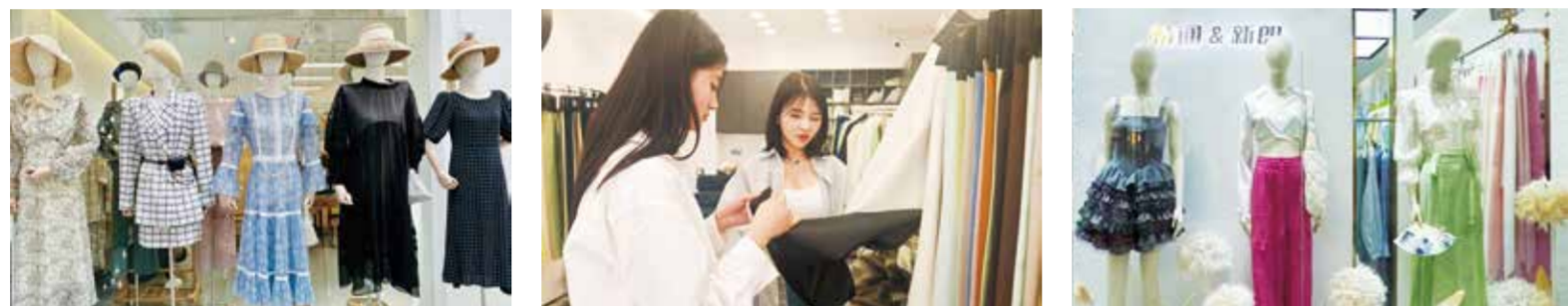
大量时尚女装高端面料企业集聚为打造“中国时尚女装面料第一站”奠定了良好基础。