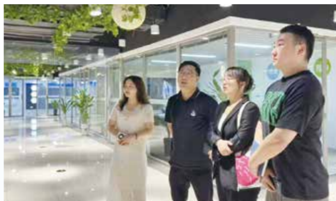
中国长丝织造协会深入吴江区调研。