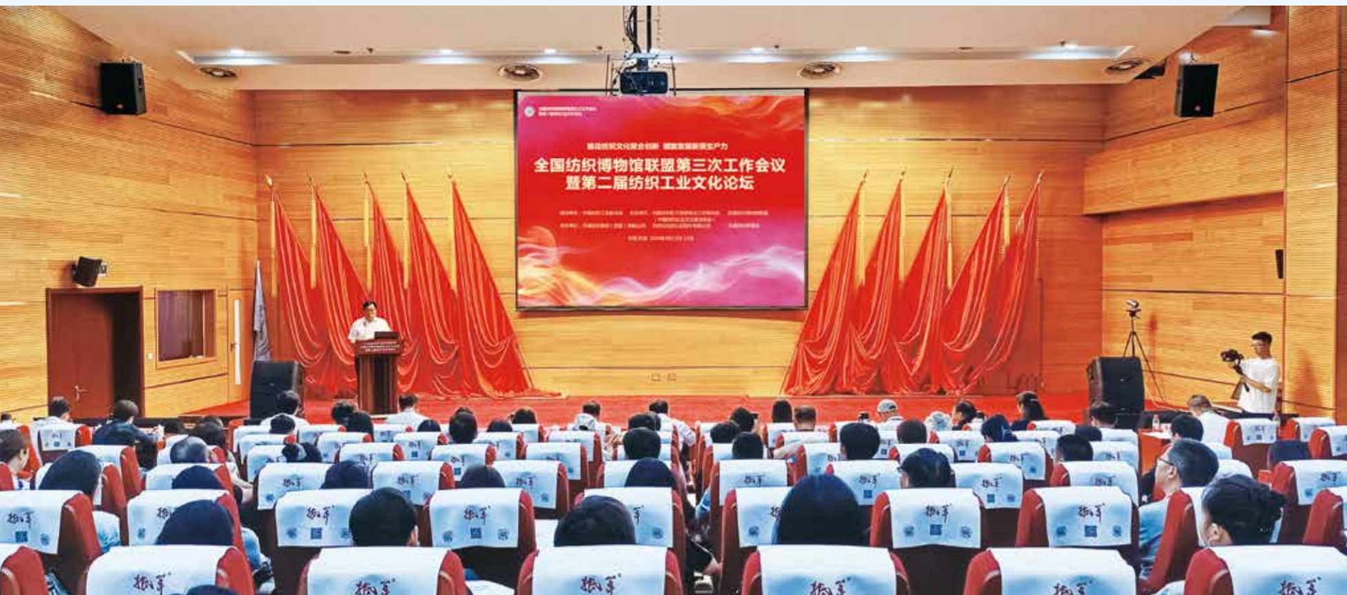
会议探索了“纺织文博+时装周”新思路。