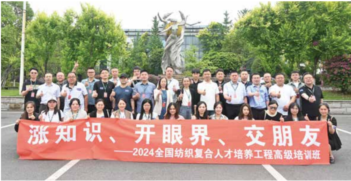
高训班开展了理论与实践相结合的教学活动。

当前，全球纺织纤维产量约1亿吨左右，化学纤维超过70%，其中约12%采用溶液纺丝工艺。“对于那些熔点高于分解温度、熔点不