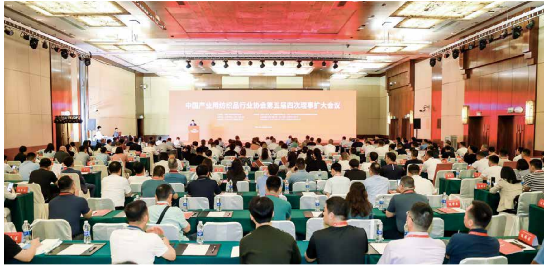
会议把脉行业发展，对未来方向进行了探讨与交流。