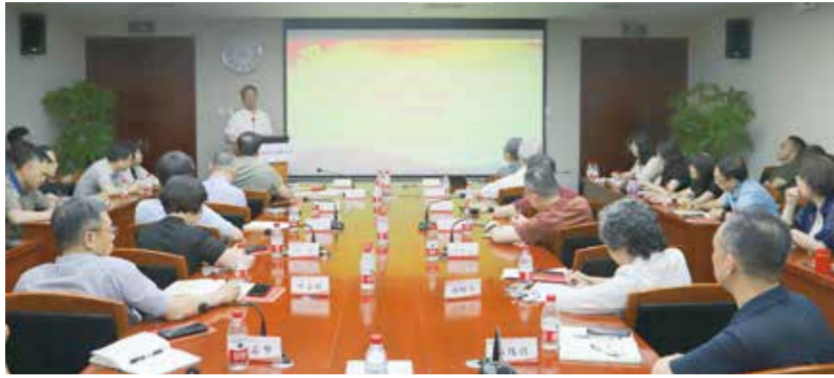
通过学习，同志们深刻领悟到党纪学习教育的重要意义。

《意见》强调，统筹用好现有资金渠道，支持跨境电商海外仓企业发展。发挥服务贸易创新发展引导基金作用，引导更多社会资本以市场化方式支持跨境电商海外仓等相关企业发展。鼓励有条件的地方用好现有股权投资基金资源，探索以市场化方式设立产业发展基金，加强对跨境电商海外仓企业支持。编制出台跨境电商出口海外仓业务退税操作指引，进一步指导企业用好现行政策。（郝杰）