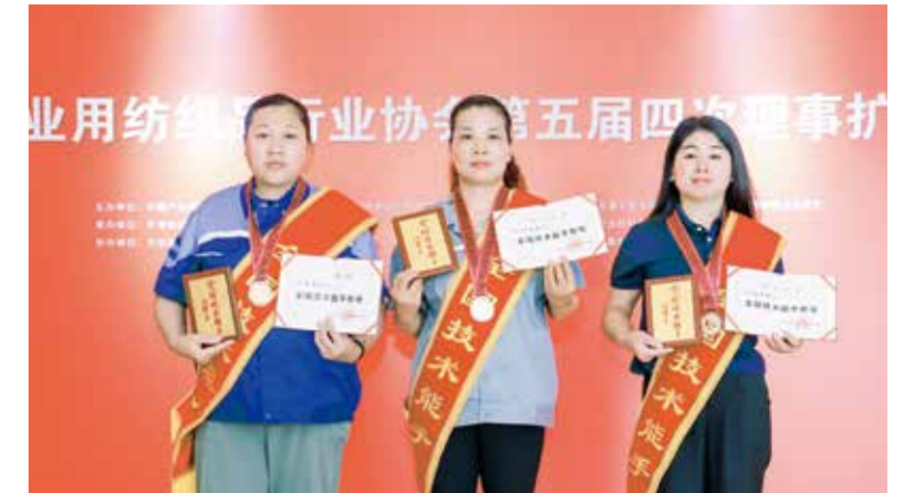
会议为3位“全国技术能手”颁发了荣誉证书。

行业长期向好的基本趋势没有改变，科技创新、人才培养、产品开发方面的持续投资增强了行业拓展新领域、抵御市场风险的内在动力。