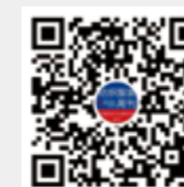
纺织服装周刊 微信视频号