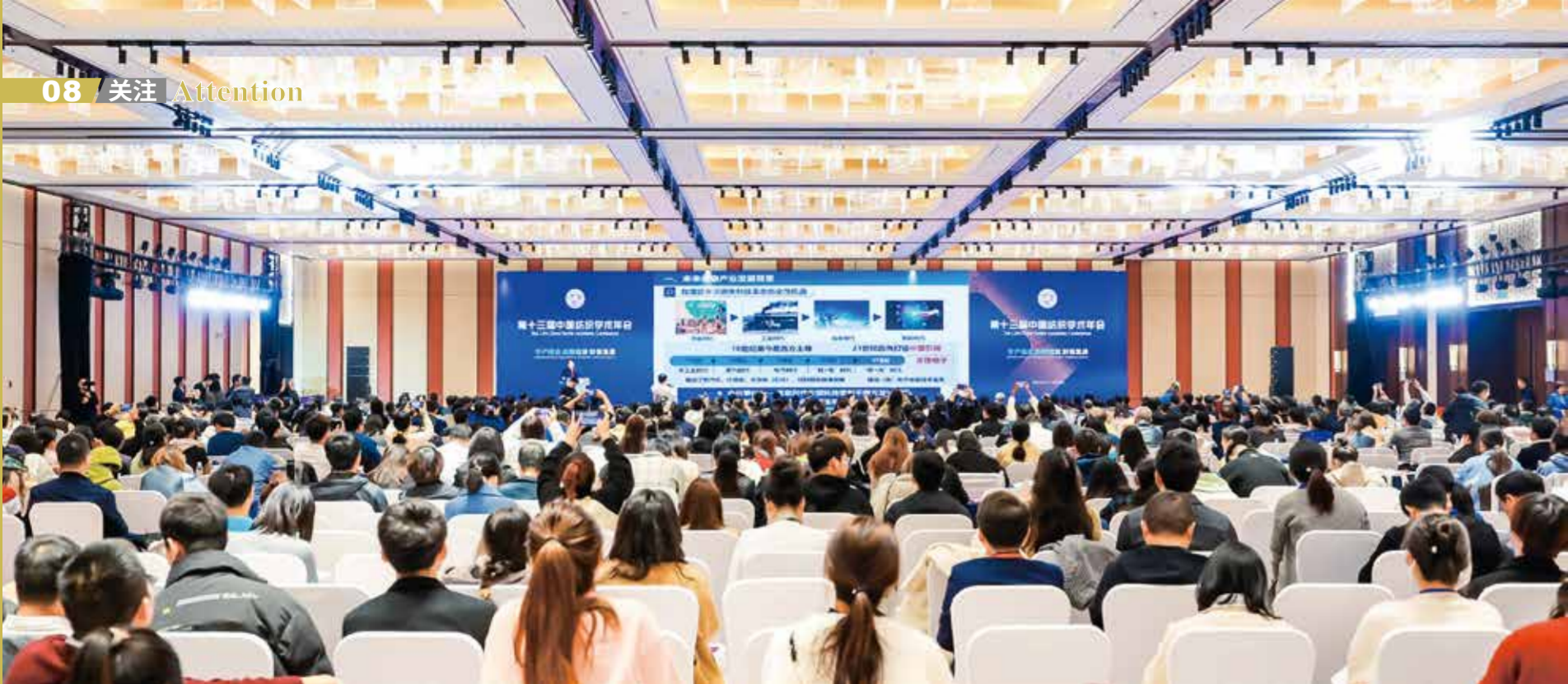
会议为行业搭建了产学研用跨界交流与合作的高效平台。