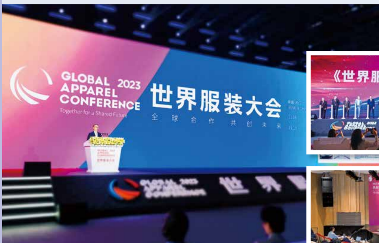
2023 世界服装大会以千人齐聚的盛况助推全球服装产业合作共赢。