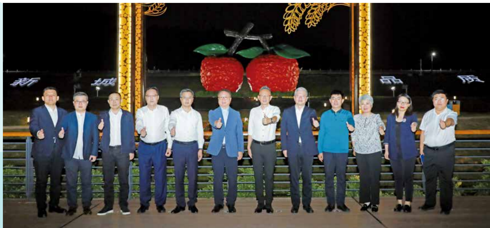
与会领导嘉宾合影。