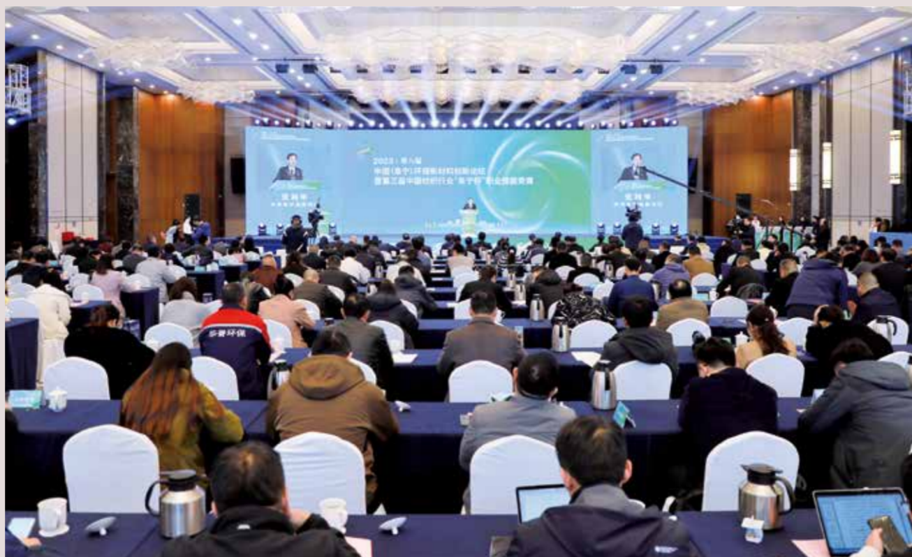
会议探讨了滤料产业的未来发展。