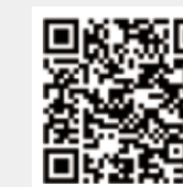
纺织服装周刊 网易号