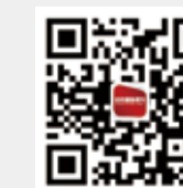
纺织服装周刊 新浪微博