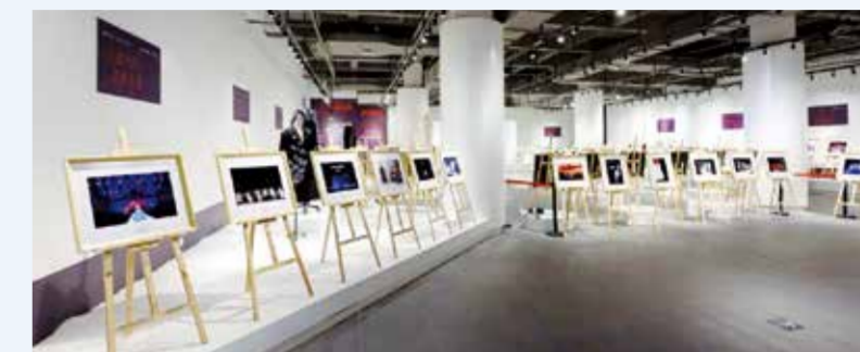
摄影作品联展现场。

联展记录了中纺摄协和江西服装学院在中国时尚行业发展历程中的精彩瞬间，向社会展示时尚摄影的魅力和价值。中国纺织摄影协会副会长王水元表示，希望通过此次影展的举办，进一步提高公众对于时尚产业的认知和关注度，助力中国时尚产业的高质量发展。