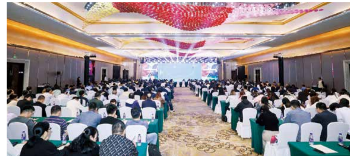
会议分享了当前最前沿的数码印花工艺。

重要平台,全球纺织品数码喷墨印花峰会已在柯桥连续举办多届,对于驱动柯桥印染行业数字化转型和绿色发展具有重要意义,越来越多的传统印花企业向数码转型,科技人才、时尚元素进一步集聚,印花明星企业影响力持续释放。今后,柯桥将以此为契机,以新技术、新模式、新供给、新业态推动柯桥数码印花行业迈上新台阶。