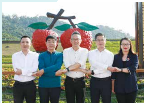
多方合力共推毛织集群发展。

产业集群是纺织工业中最鲜明的结构特征和最重要的组织形态，集群经济占据了纺织行业的半壁江山。产业集群的不断发展壮大，有力地支撑了我国纺织产业规模的扩张和国际竞争力的提升。