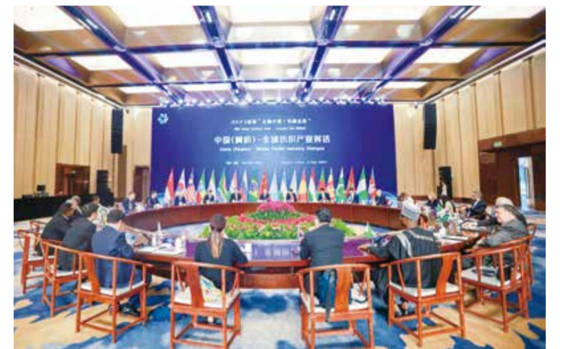
各国代表展开深入对话。

“当前全球格局正在经历剧烈的变化,合作共赢、维护可持续的价值链是一个关键课题。我作为一名绍兴人,非常荣幸能够参加此次会议,为家乡的纺织产业贡献自己的一份绵薄之力。”联合国工业发