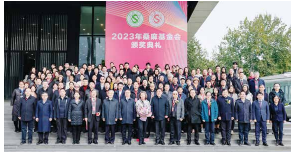
与会领导、嘉宾与师生合影。

随着2021年、2022年、2023年桑麻奖学金教金评选工作的结束，因新冠疫情暂停举办的桑麻基金会颁奖典礼重启。11月15日，2023年桑麻基金会颁奖典礼在北京服装学院举行。