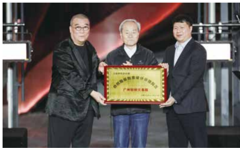
广州中大门荣获“纺织服装创意设计示范平台”荣誉称号。

为推进纺织行业供给侧结构性改革，加强纺织服装创意设计能力建设和自主品牌建设，国家工信部推动“纺织服装创意设计试点示范园区（平台）”建设，旨在通过试点示范，助力行业增品种、提品质、创品牌，推动纺织服装产业转型升级。2017年，广州中大门（原“广州轻纺交易园”）获全国首批“纺织服装创意设计试点平台”，并开启了一系列推动行业升级衍化的创新举措。今年11月3日，经广