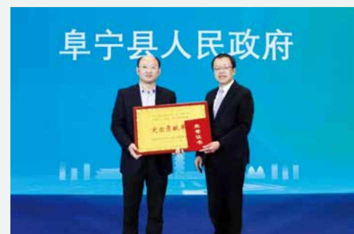
会议为本次竞赛“突出贡献单位”颁发牌匾。

江苏省纺织工业协会会长韩平也表示，江苏纺织产业总量约占全国纺织近五分之一，是本省经济的支柱产业。基于纺织产业的优势，近几年，江苏产业用纺织品行业也得到快速发展，其中过滤纺织品和安防用纺织品是江苏的特色产业。他建