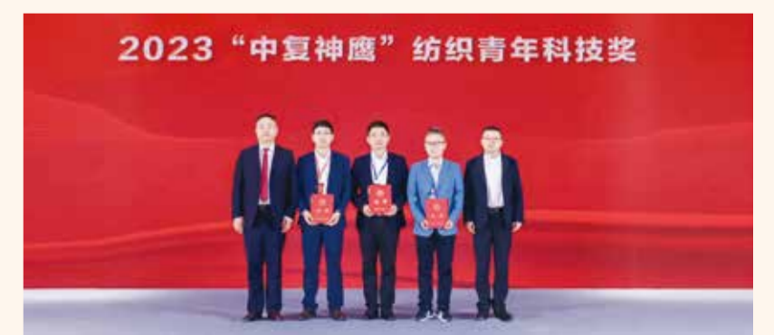
2023 “中复神鹰”纺织青年科技奖