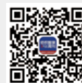
纺织服装周刊 微信订阅号