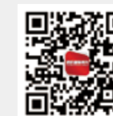
纺织服装周刊 今日头条号