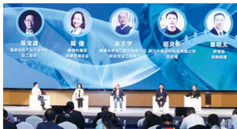
论坛围绕多元议题为企业拓宽发展思路。

为进一步提升功能性材料的竞争力,近日,2023国际功能性纺织新材料论坛在柯桥举办。围绕“功能碰撞时尚·科技交织未来”主题,本次论坛就全球功能性纺织材料技术发展的新趋势、新模式、新路径展开了多维分享与深度探讨,为谋求升级的柯桥纺织企业提供了实用的产品开发思路与产业链协同创新方案。