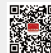
纺织机械 微信订阅号