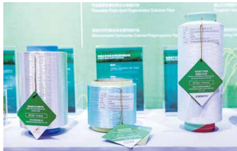
桐昆·中国纤维流行趋势 2023/2024 发布了 30 种新型流行纤维品种。

11月17日,桐昆·中国纤维流行趋势 2023/2024 发布总结会在北京举行。会议总结了桐昆·中国纤维流行趋势 2023/2024 的发布内容及创新工作,分析了发布效果,并介绍了后续工作计划。与会领导和嘉宾为下一步的发展提出了建议。