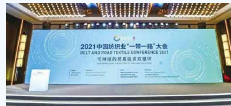
大会在十年间耕耘不辍，引发行业共鸣。图为往届会议。