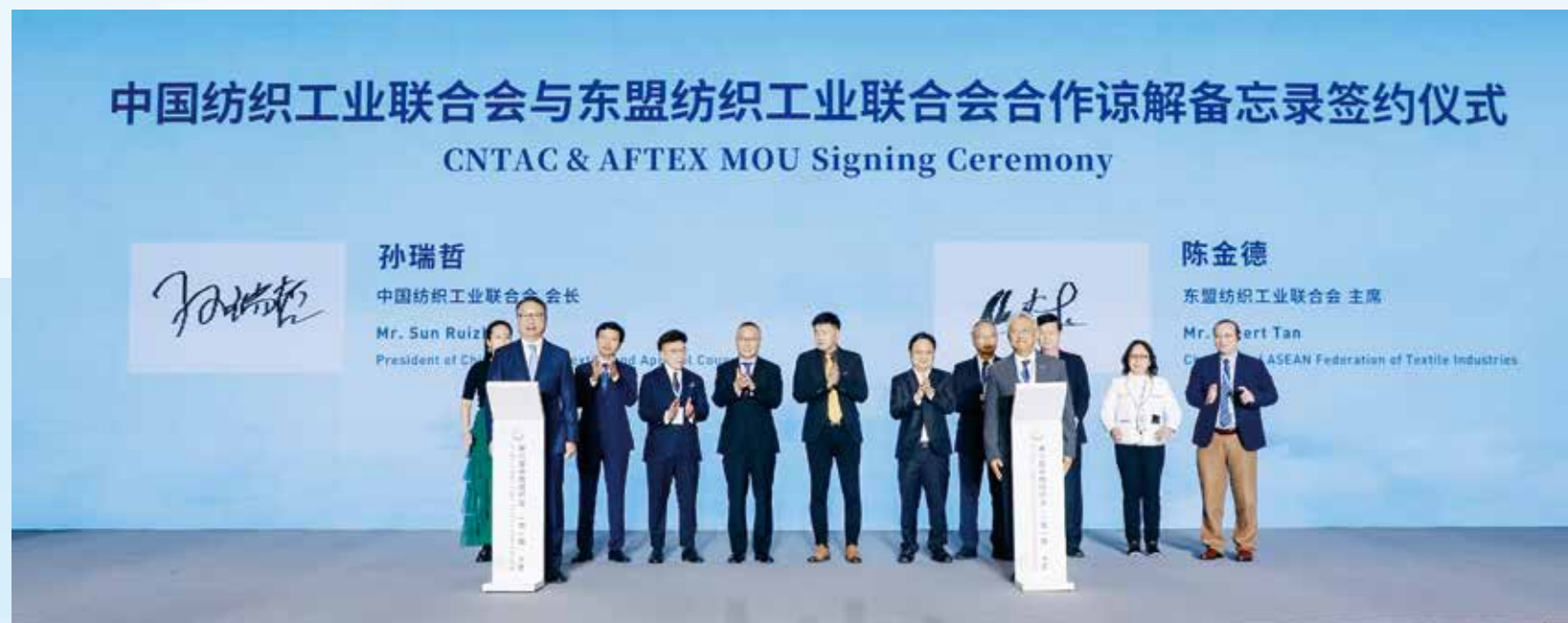
在中国与东盟各国纺织服装商协会代表的见证下，国际纺织制造商联合会主席、中国纺织工业联合会会长孙瑞哲和东盟纺织工业联合会主席陈金德代表双方签订合作谅解备忘录。