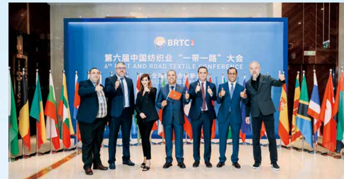
大会搭建了沟通交流的平台，纺织业共建“一带一路”朋友圈不断扩大。

十年时间，纺织行业企业积极建立与“一带一路”共建国家和地区相关产业的沟通交流，寻求全产业链的合作共赢，纺织业“一带一路”朋友圈不断扩大。值得一提的是，本届大会再次汇聚全球行业发展的经验与智慧，共“织”繁荣锦绣未来。一个个镜头，记录了大会的智慧成果与精彩瞬间。