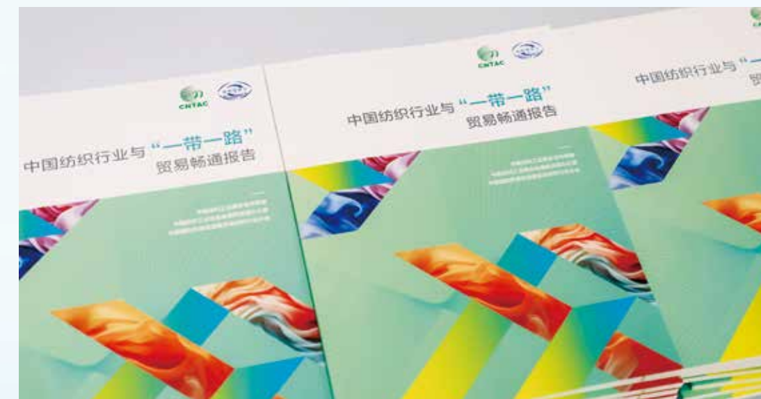
大会发布智慧成果，为行业企业投身“一带一路”建设提供精准参考和指南。