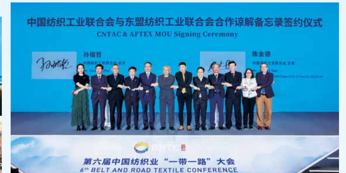
各国来宾欢聚一堂，共同展望纺织业国际合作的美好前景。