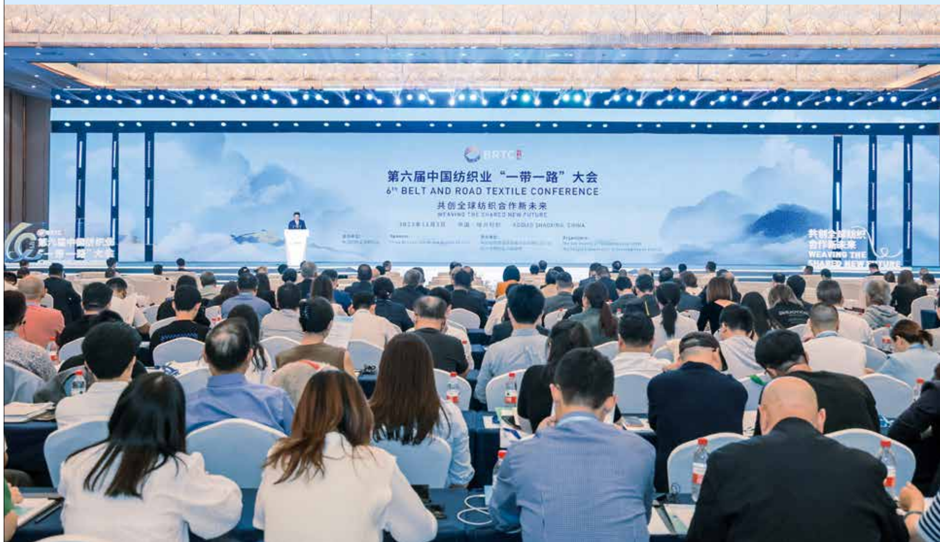
2023年11月3日,第六届中国纺织业“一带一路”大会在绍兴柯桥召开。