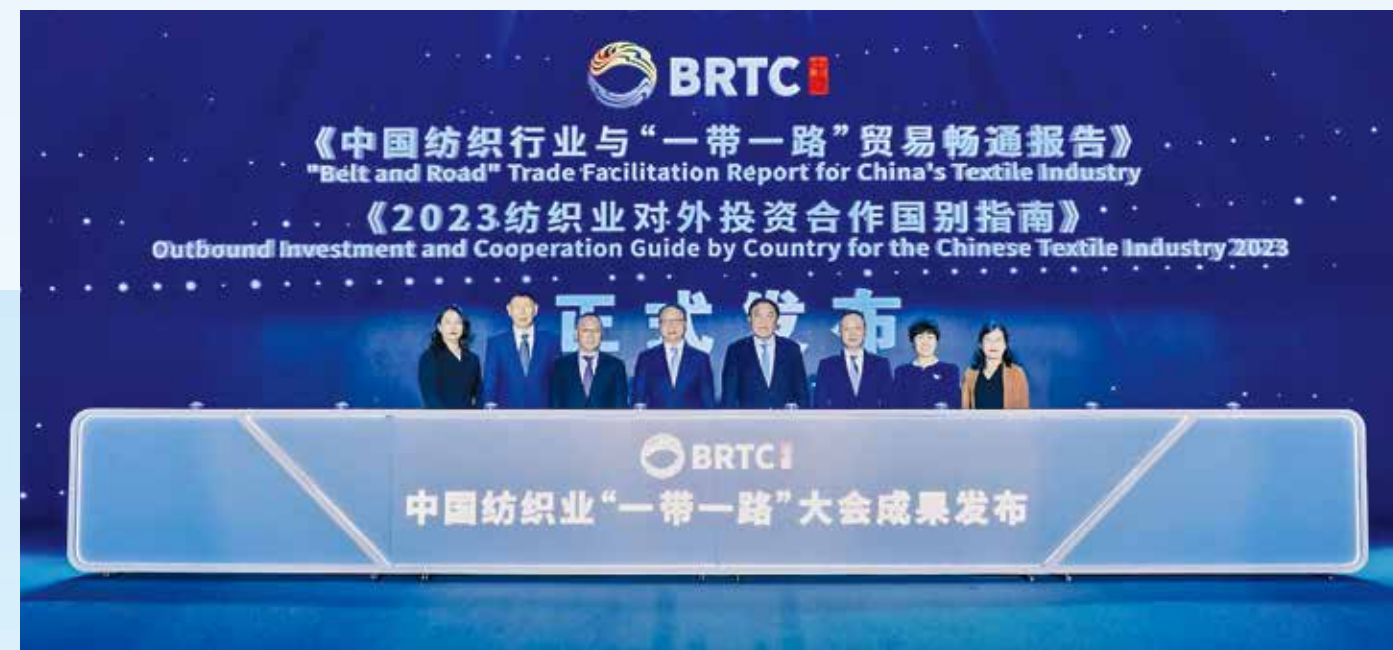
中国纺织工业联合会市场部、国际贸易办公室，中国国际贸易促进委员会纺织行业分会联合发布了《中国纺织行业与“一带一路”贸易畅通报告》《2023纺织业对外投资合作国别指南》。