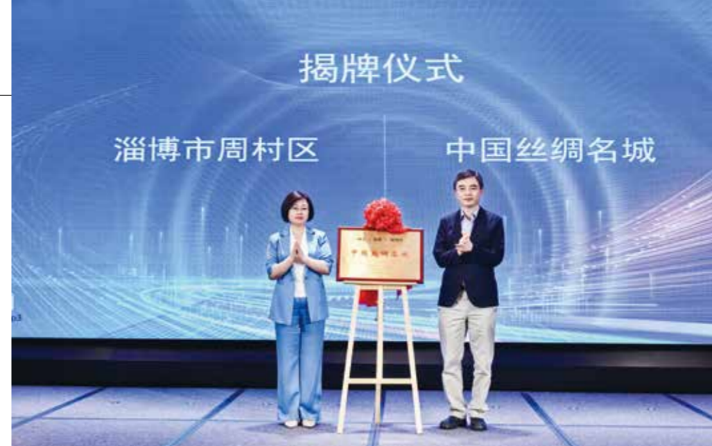
与会领导为“中国丝绸名城”揭牌。