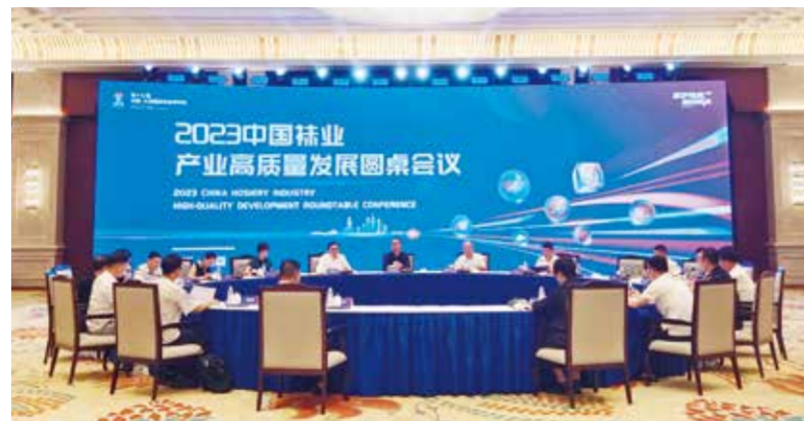
会议围绕数字赋能、可持续发展等议题展开了深入探讨。

要更加聚焦“文化”这个核心，立足诸暨“三个之都”“三个之乡”等资源，以及教育、科技、体育等领域的优势，带动产业全面发展。