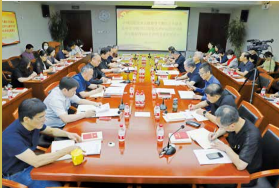
50余人出席会议。图为会议现场。

8月11日，中国纺联党委召开主题教育专题民主生活会集中学习暨2023年第七次中心组学习会及主题教育评估工作征求意见座谈会，为下一步开展主题教育专题民主生活会打牢基础，科学客观评估中国纺联党委主题教育成效，进一步推进主题教育走深走实。