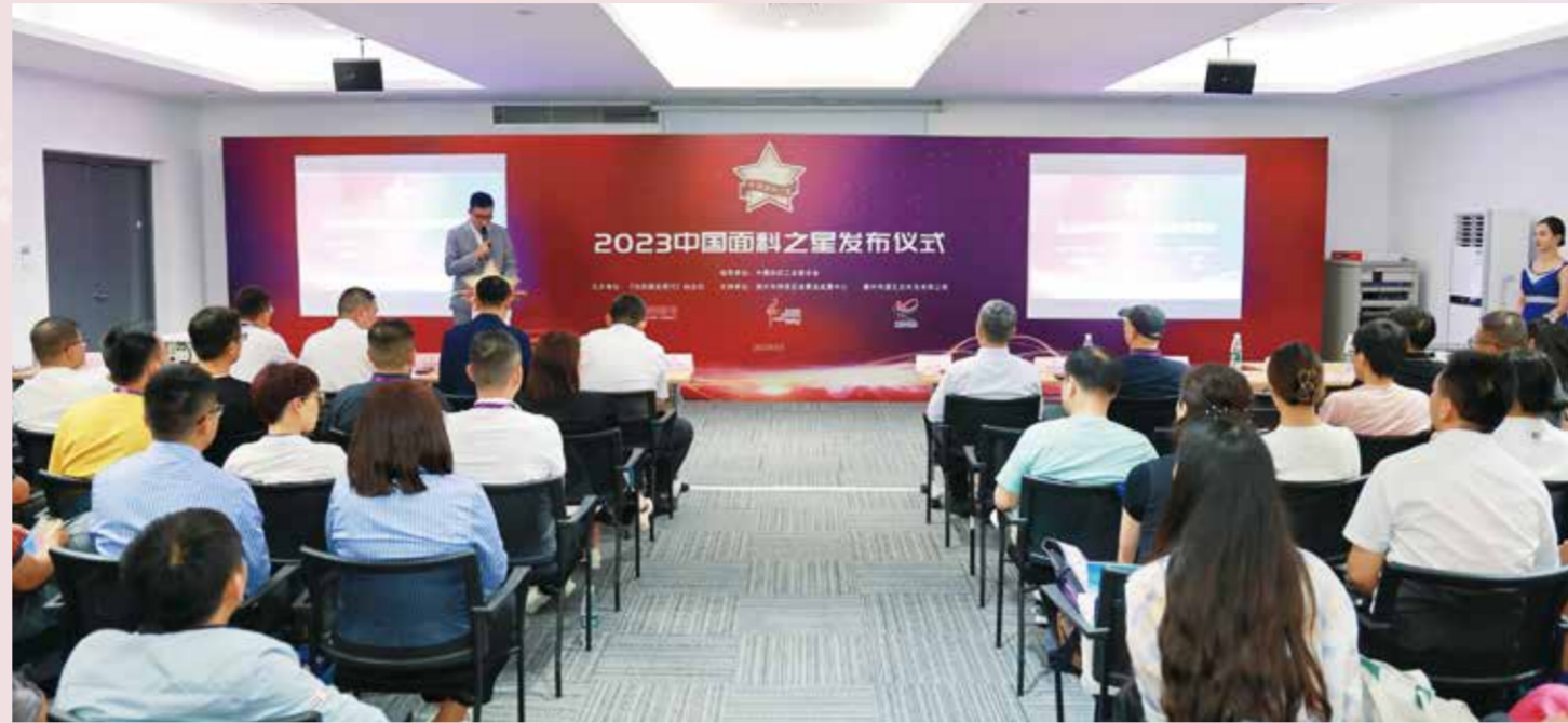
2023 中国面料之星发布仪式公布了八大面料产品调查结果。