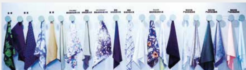
大赛参评产品在科技、品质、环保等多个方面表现亮眼。