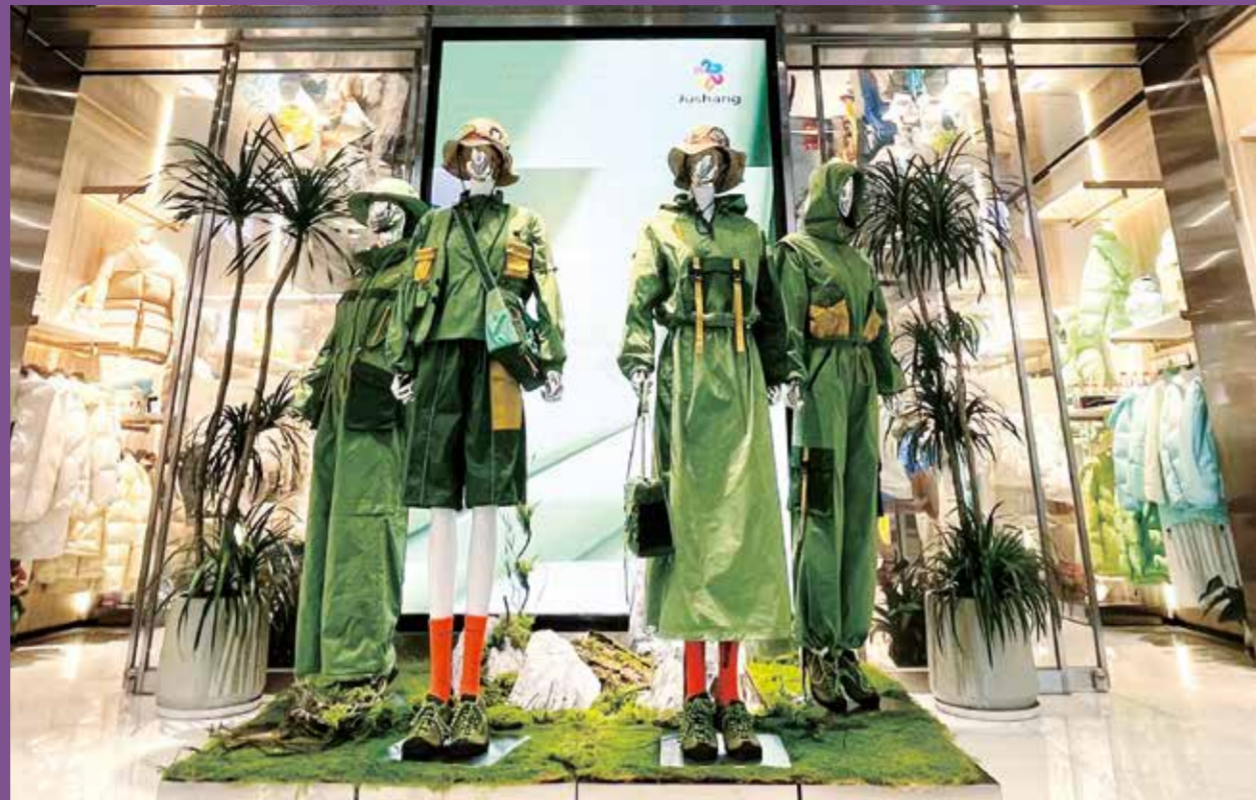
柯桥纺织企业通过独具匠心的面料设计、个性化的橱窗陈列技巧、多元化的市场拓展策略，积极从同质化竞争中突出重围。