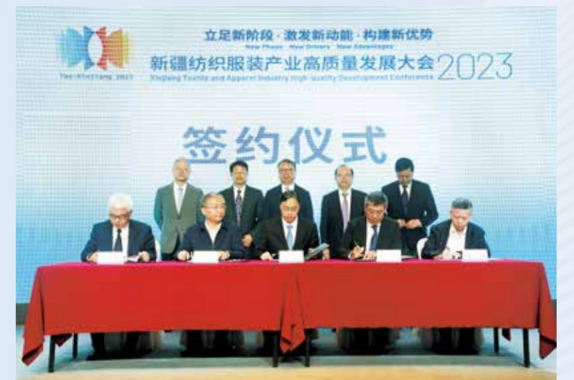
合作协议的签订预示着双方将形成合力，共推产业发展。

团等10家供应链代表企业现场签约进驻线上云纱网产业互联网平台。另外，11家棉纺织代表企业签约落户广州北·中大时尚科技城线下大卖场。