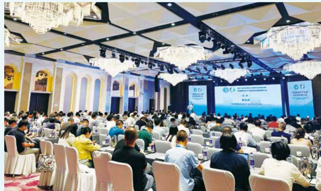
作为“优供给促升级”系列活动之一，本次大会吸引了近300人参加。

为应对这些挑战，中国棉纺织行业协会会长董奎勇在致辞时提出以下建议：回归本质、提高产品核心竞争力，加强政策引导、