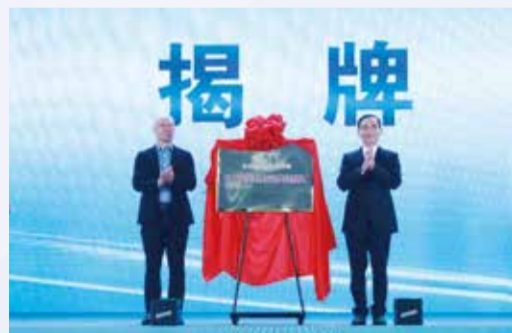
中国纺织工业企业管理协会与荆州市沙市区共同为金色童年小镇·科创园“优质童装供应链共建基地”揭牌。

5月26日，绘织荆彩·童行未来——金色童年小镇·科创园开园仪式在“中国针织名镇”、“中国婴童装名镇”湖北省荆州市沙市区岑河镇举行。为推动纺织服装产业行稳致远，荆州市委市政府认真贯彻落实党的二十大精神 and 湖北省第十二次党代会部署，锚定打造 500 亿级产业目标，不断完善产业链条，持续做大产业规模，全力推动产业转型升级。