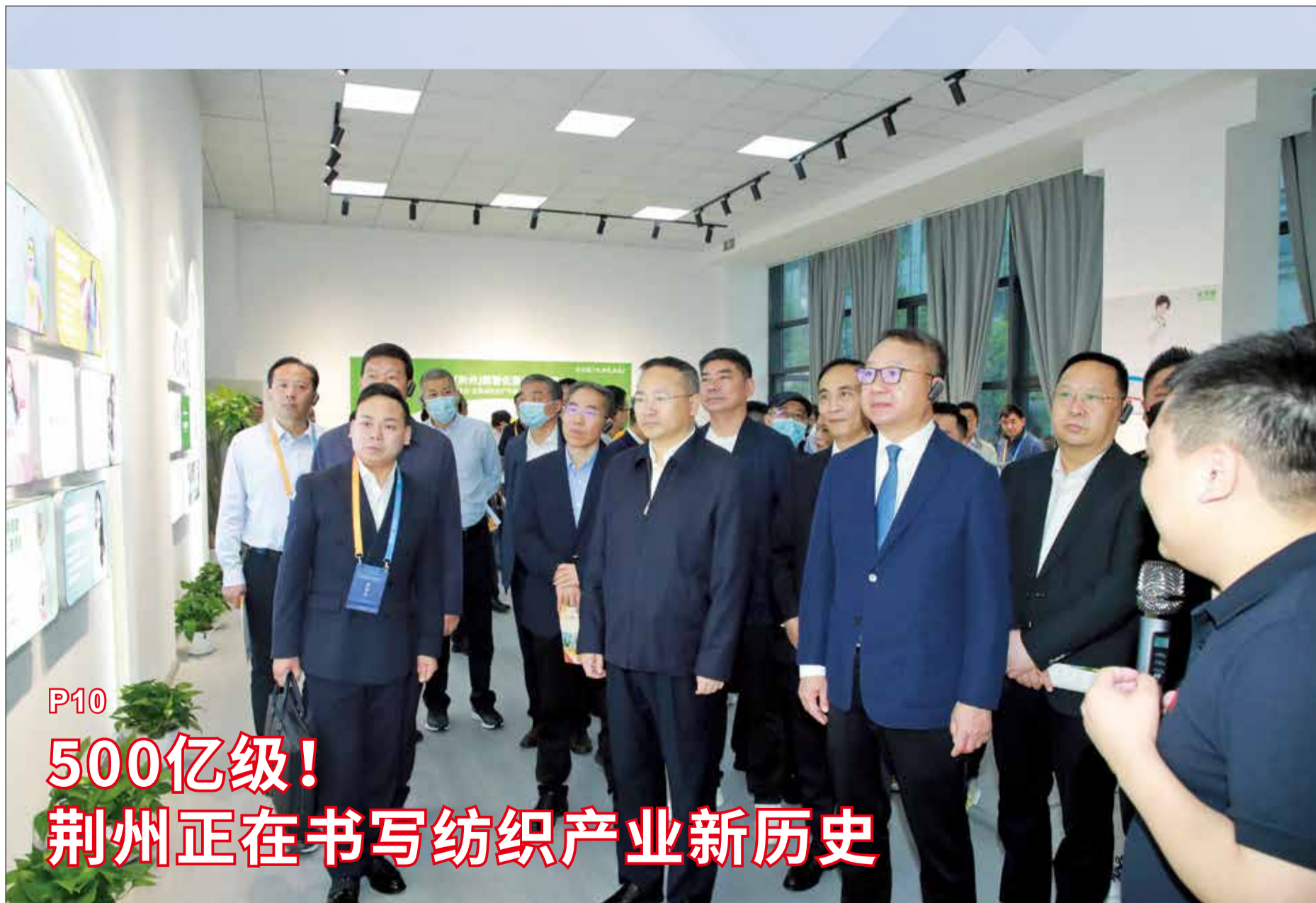
5月26日,金色童年小镇·科创园开园仪式在湖北省荆州市岑河镇举行。图为与会领导参观科创园。