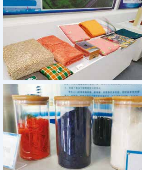
中芳公司是目前世界唯一一家芳纶生产企业。