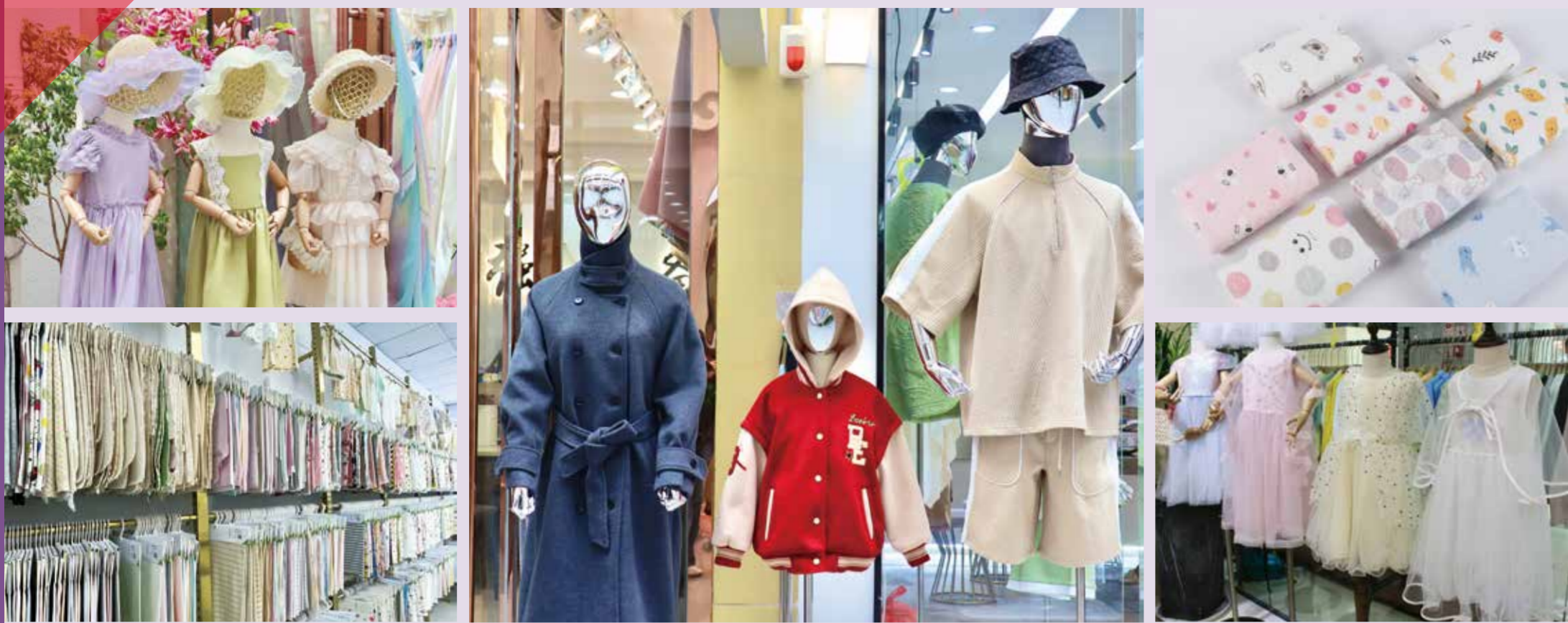
品质、科技、创意是柯桥婴童面料升级的有力抓手。