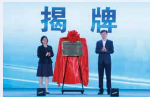
中国印染行业协会为荆州经开区“中国绿色印染创新示范基地”揭牌。