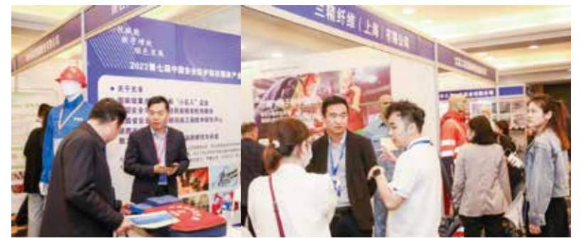
会场外企业深入交流。

防行业可持续发展”演讲。孙兰收表示，兰精FR是基于莫代尔工艺生产的本质阻燃纤维素纤维，用该种纤维制成的面料符合不同领域的阻燃标准，舒适性、耐久性良好，不需要有毒的化学品做整理，对环境的影响小。阻燃防护服的发展趋势是：防护—舒适性—工装时装化—绿色可持续发展。兰精近两年不断推出具有可持续发展的纤维产品，为阻燃防护服开发提供了广阔空间。