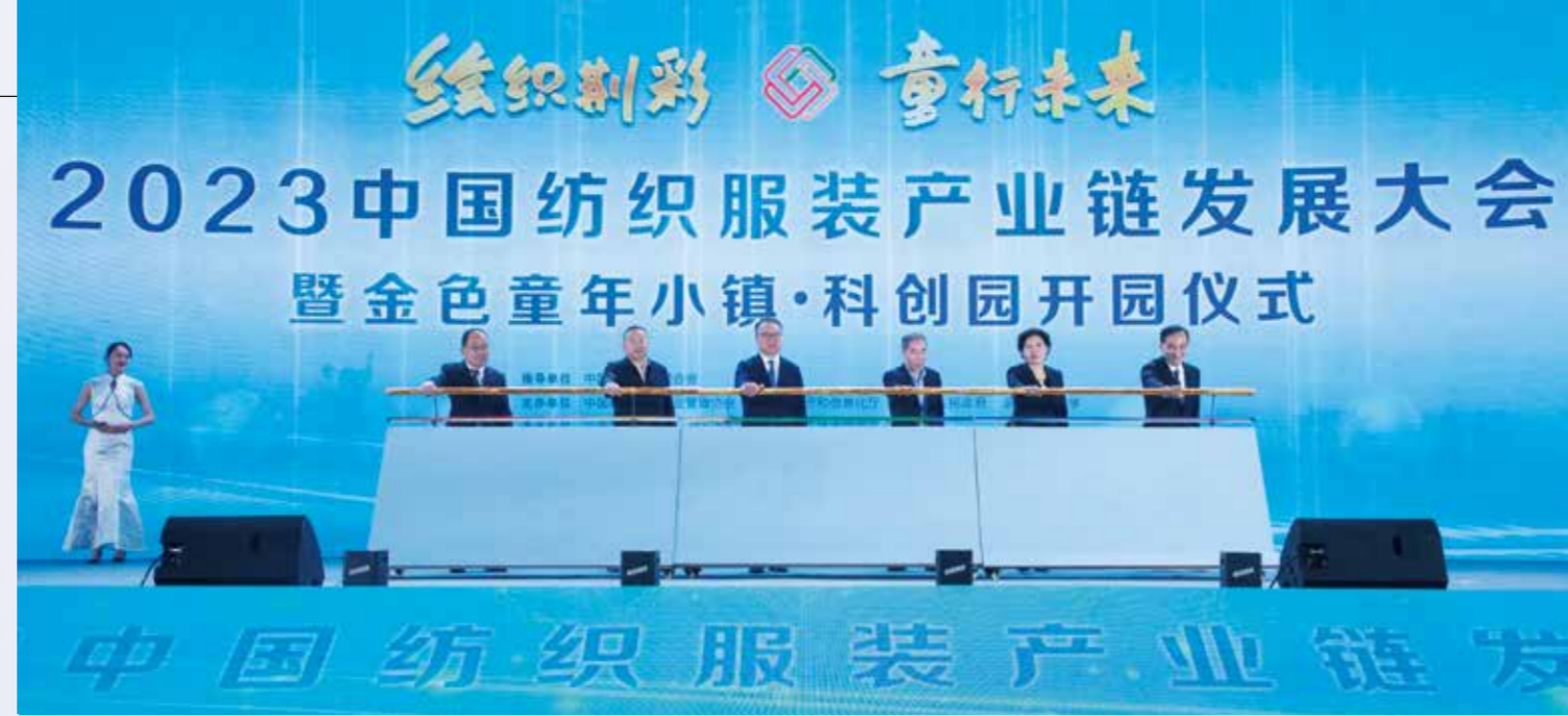
中国纺织工业联合会会长孙瑞哲，中国工程院院士、武汉纺织大学党委副书记、校长徐卫林，湖北省经信厅党组成员、副厅长周开斌，中共荆州市委书记吴锦，中共荆州市委副书记、荆州市人民政府市长周志红，中共荆州市沙市区委书记黄勇共同为金色童年小镇·科创园一期开园、二三期开工推杆。