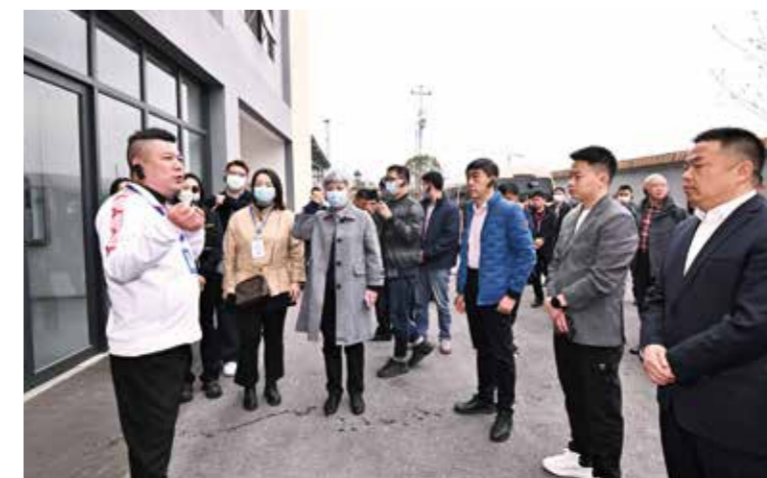
与会代表参观了三台县优秀企业。

会上，张海燕作了《全国纺织服装产业园区试点(示范)发展情况报告》。报告指出，目前园区企业总体运行良好，对经济贡献较大，