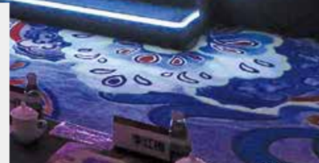
2023 中国服装论坛现场。