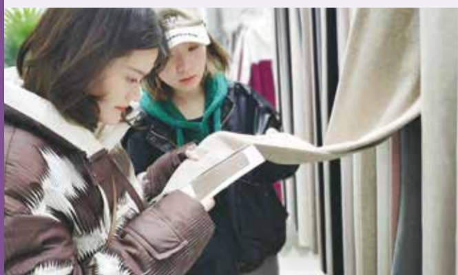
兔年开市以来，轻纺城市场交易红火、惊喜不断，外贸内销全面复苏，经营户们干劲十足开新局，全力夺取首季“开门红”。