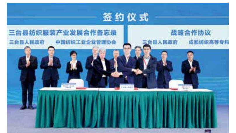
会议举办了相关签约仪式。

从增长幅度上看，各项经济指数均有提升，园区总体呈良好发展趋势，产业园区内企业集聚化发展特征较为明显，同时，园区规划空间还有承载能力。值得关注的是，西部园区有生产要素保障能力和成本优势，中部园区劳动力成本优势明显。从调研来看，中部园区亩均投入产出效率较高，但东部园区人均产值水平较好。