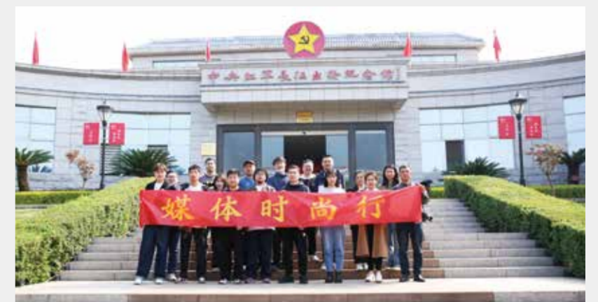
20家国内知名媒体代表齐聚于都，见证于都发展新风貌。