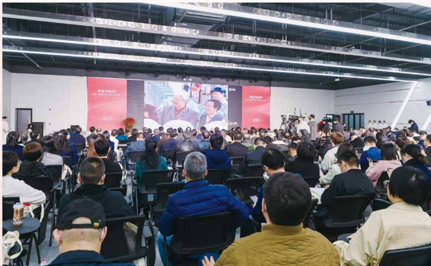
会议倡议全国纺织人争做新时代最美奋斗者。