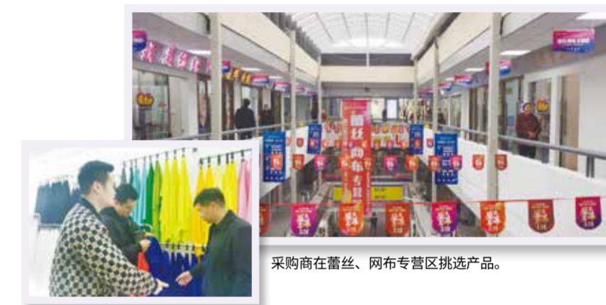
采购商在蕾丝、网布专营区挑选产品。

“为了此次专营区隆重开业，市场一方面对采光井、吊顶、墙面进行改造，并增设电梯，预计投入了近500万元；另一方面前往福建长乐、广州中大