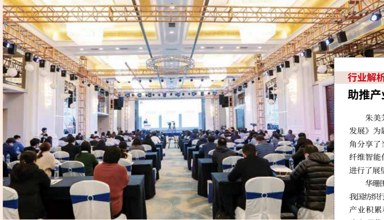
研讨会围绕行业优质企业培育进行了深入探讨，引起行业企业广泛关注。