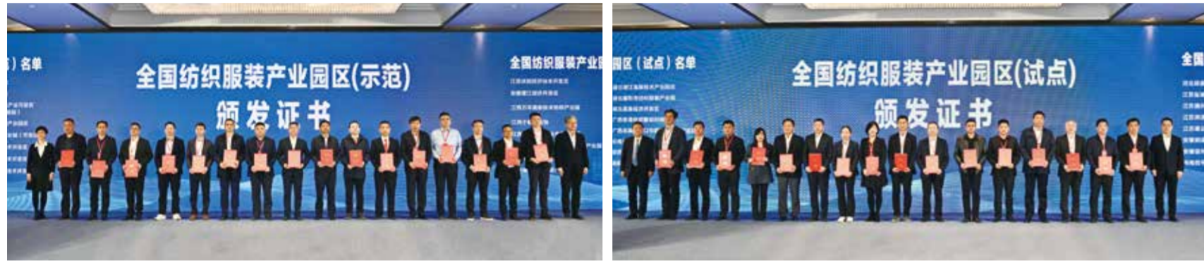
会议为通过复查的全国纺织服装产业园区试点(示范)颁发证书。