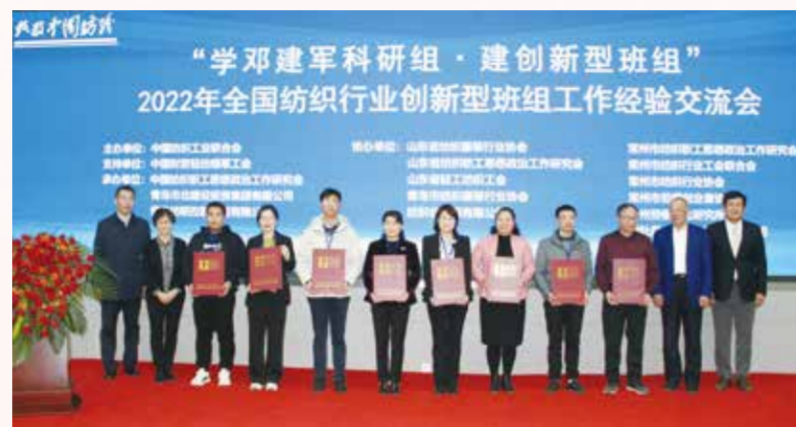
与会领导为获表彰的班组颁发证书。

刘建国在大会致辞中说，70多年前的郝建秀，30多年前的邓建军，他们“勇挑重担、拼搏创新、乐于奉献、争创一流”的“火车头精神”，争做知识型、技能型、创新型工人阶级班组的伟大品格和时代精神，始终激励着我们踔厉奋发，勇于创新，不断进取，接续创造纺织业新的辉煌。为适应新时代纺织经济高质量发展需要，知识型、技能型、创新型产业人才，是产业发展的必然要求。争创世界一流，勇攀技术高峰，实现自我超越、自我升华，是我们的不懈追求，全国各兄弟省市涌现出的众多创新型先进班组，给予我们极大的鼓舞和启发，是我们学习的好榜样。