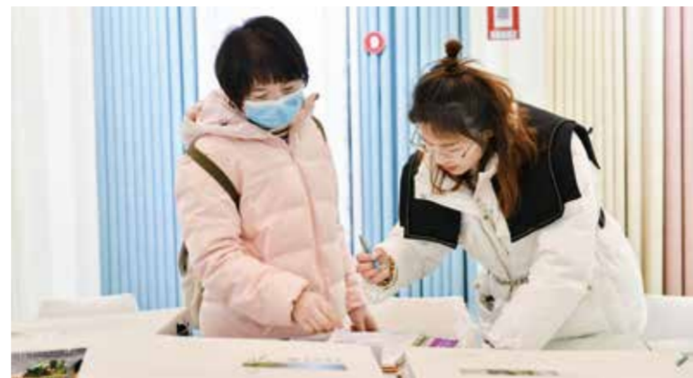
柯桥窗帘企业不断自我革新，为客户提供窗帘新选择。

轻用户的消费偏好和个性需求，方能取得先机。柯桥窗帘企业由表及里，纵深研发，不断自我革新，为客户提供窗帘新选择，差异化成为新品窗帘能否成功“破圈”的关键性因素。