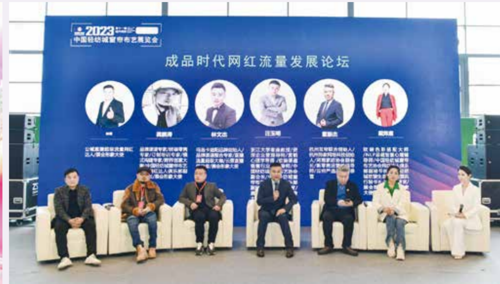
柯桥窗帘布艺展以“新品首发、商贸首选”功能，助力行业的复苏与发展，提振信心。