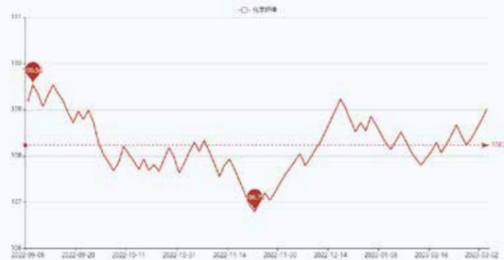
图2 盛泽市场化学纤维价格指数

这番话缓解了早些时候引发的担忧,当时强劲的美国就业数据让投资者担心可能会有更快、更大幅度的加息。截至3月2日收盘,纽约商品交易所4月交货的轻质原油期货价格上涨0.47美元,收于每桶78.16美元,涨幅为0.60%;5月交货的伦敦布伦特原油期货价格上涨0.44美元,收于每桶84.75美元,涨幅为0.52%。