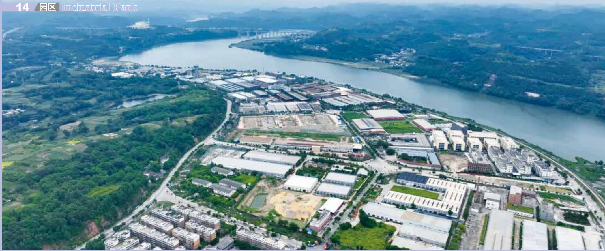
如今，三台县已成为纺织服装产业发展的一片热土。