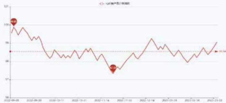
图1 盛泽市场化纤类产品价格指数

据对350家被采价单位反馈的数据监测分析,本周商务部中国·盛泽丝绸化纤指数小幅上涨。其中,化纤总指数收盘于99.06点,与上周相比上涨了0.52点;化纤面料价格指数上涨,收盘于98.94点,与上周相比上涨了0.09点;化学纤维价格指数小幅上涨,收盘于109.01点,与上周相比上涨了0.58点。本周蚕茧丝绸类产品价格指数小幅下降,收盘于107.73点,与上周相比下降了0.17点。