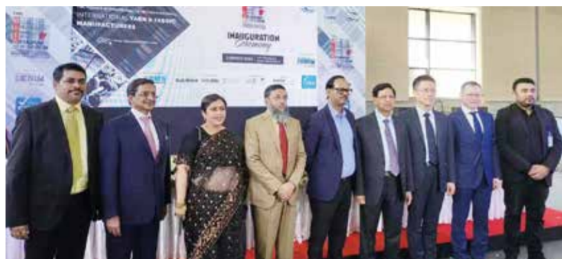
相关领导嘉宾出席了孟加拉冬季展开幕式。

日前,由中国国际贸易促进委员会纺织行业分会与CEMS国际展览公司携手举办的孟加拉达卡国际面料及纱线展览会(冬季)-DIFS Winter 2023(以下简称“孟加拉冬季展”)在孟加拉达卡国际会议中心(ICCB)举行。