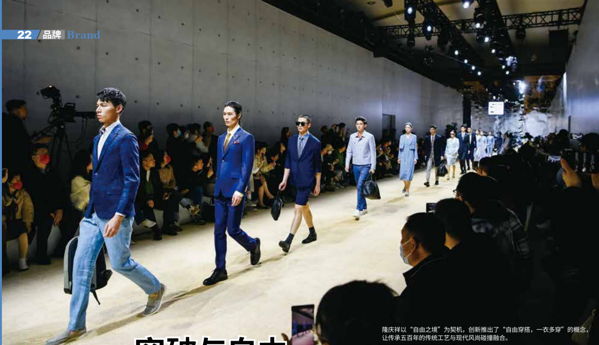
隆庆祥以“自由之境”为契机，创新推出了“自由穿搭，一衣多穿”的概念，让传承五百年的传统工艺与现代时尚碰撞融合。