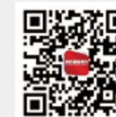
纺织服装周刊 今日头条号