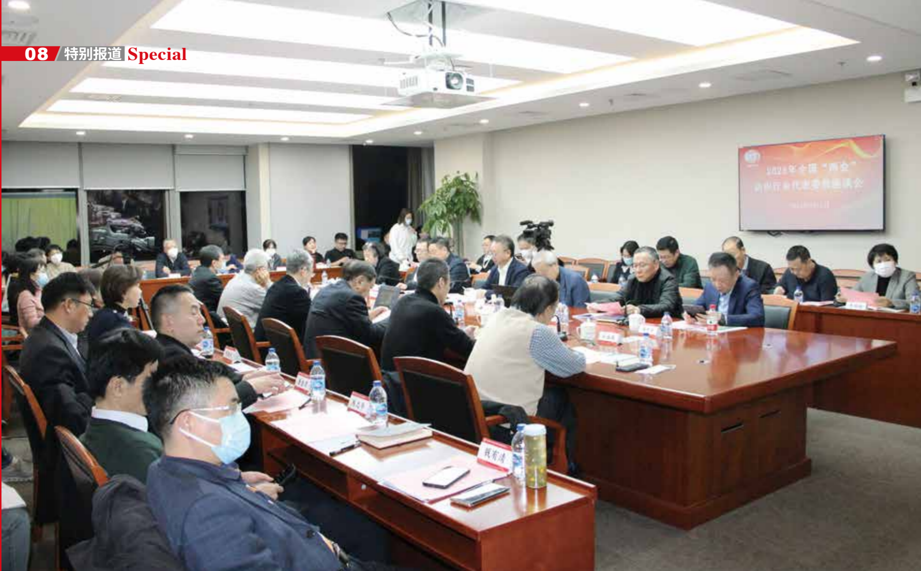
中国纺织线下会场。