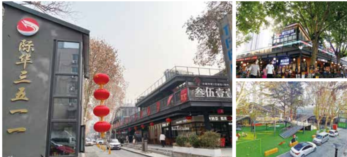
园区打造的一刻钟便民生活圈，入选首批“高品质一刻钟便民生活圈”，成为西安市新兴的“城市文旅新地标”。

沿着金属质感的连廊拾级而上，笔直的立面线条营造出粗犷简约的工业风，斑驳的树影映照在玻璃幕墙上，其间点缀着园区独创的“花先生”与“鱼小姐”IP 形象，成为年轻人的朋友圈“新宠”。柴米油盐、花鸟鱼