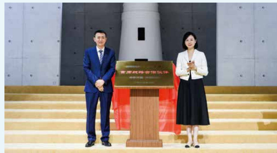
发布秀上，隆庆祥与中国纺织工业联合会会刊《纺织服装周刊》结成“首席战略合作伙伴”。

同时，主题“自由之境”也预示着隆庆祥自身迈入了新境界。过往，传承五百年的隆庆祥自带历史厚重感，这是品牌的底层气质与文化标签，在前行中寻思变、求突破，