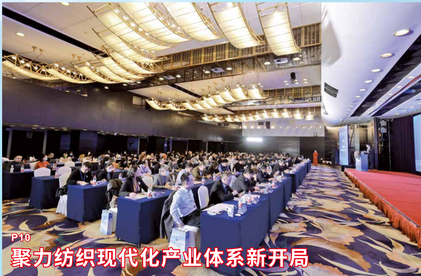
P10 聚力纺织现代化产业体系新开局