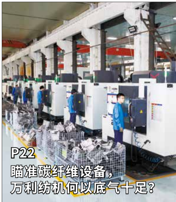
P22 瞄准碳纤维设备， 万利纺机何以底气十足？