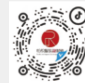
纺织服装融媒体 抖音号