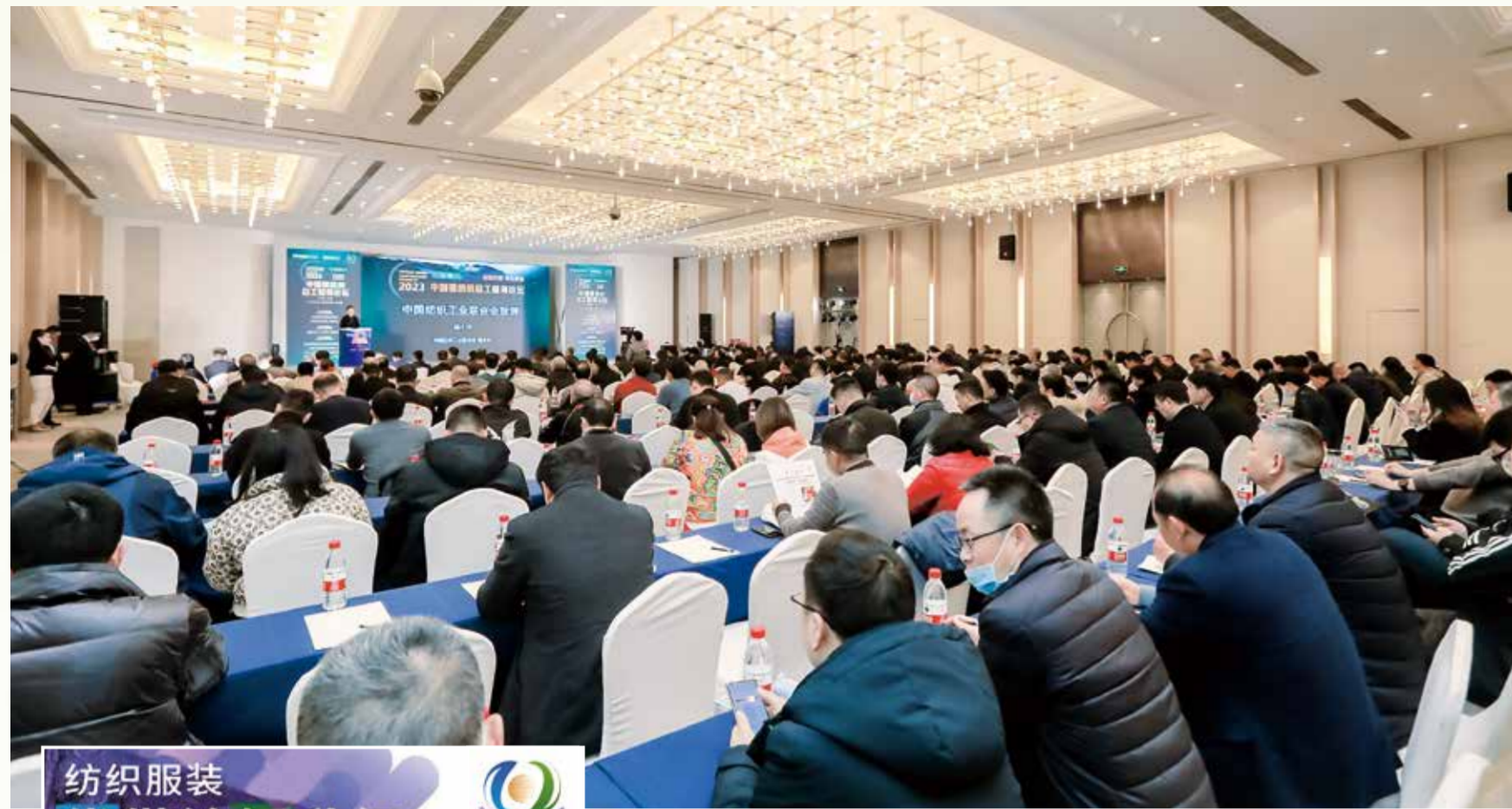
本次论坛探讨了全面提升棉纺织行业发展质量及综合竞争力的路径。