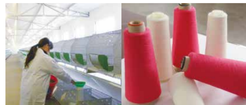
蒙阴县长毛兔产业发展前景可期。

蒙阴县是“山东省纺织服装产业基地县”、“国家差别化纤维色纺纱线产品开发基地”、“山东省纺织工业十佳产业集群”。全县共有21家规