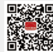
纺织机械 微信订阅号