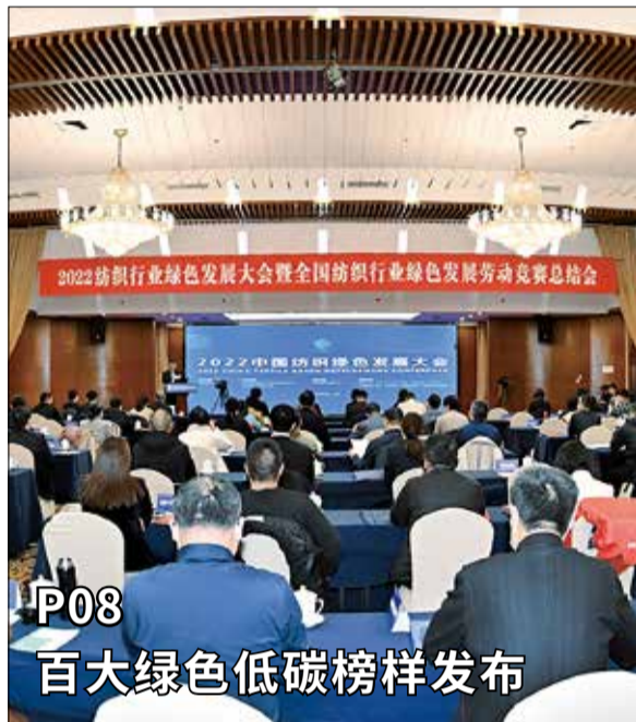
P08 百大绿色低碳榜样发布