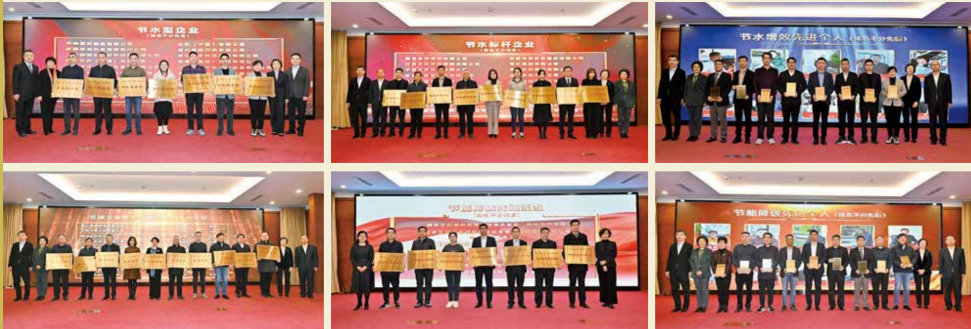
与会领导为获奖企业颁奖。