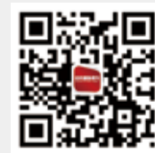
纺织服装周刊 新浪微博