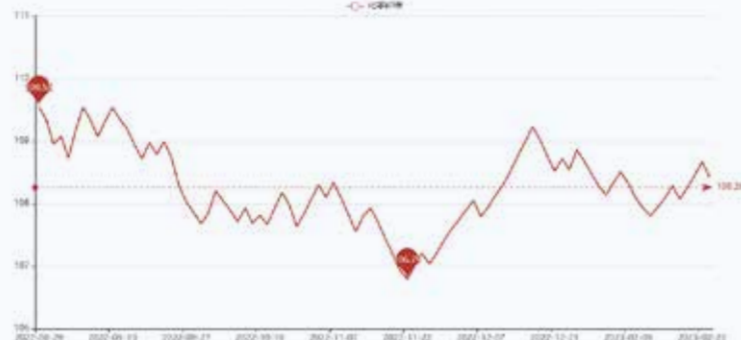
图2 盛泽市场化学纤维价格指数

本周国际油价先跌后涨，整体小幅下跌。随着近期美联储官员纷纷发表鹰派言论加之最新的美联储货币政策会议基调强硬，引发市场担忧，美联储恢复大幅加息举措，加剧美国经济活动进一步放缓的担忧。此外，美国原油库存大幅增加，国际油价2月22日继续下挫，跌至逾两周低点。但中国重新开放提升原油需求和俄罗斯减产的情况，为油价提供些许支撑。截至2月23日收盘，纽约商品交易所4月交货的轻质原油期货价格上涨1.44美元，收于每桶75.39美元，涨幅为1.95%；4月交货的伦敦布伦特原油期货价格上涨1.61美元，收于每桶82.21美元，涨幅为2%。