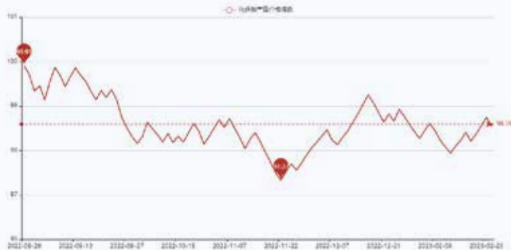
图1 盛泽市场化纤类产品价格指数

据对350家被采价单位反馈的数据监测分析，本周商务部中国·盛泽丝绸化纤指数小幅上涨。其中，化纤总指数收盘于98.54点，与上周相比上涨了0.13点；化纤面料价格指数上涨，收盘于98.45点，与上周相比上涨了0.12点；化学纤维价格指数小幅上涨，收盘于108.43点，与上周相比上涨了0.14点。本周蚕茧丝绸类产品价格指数小幅回落，收盘于107.9点，与上周相比下降了0.06点。