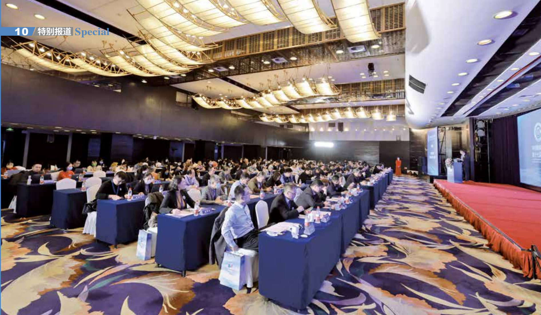
论坛围绕聚力纺织现代化产业体系新开局展开研讨。