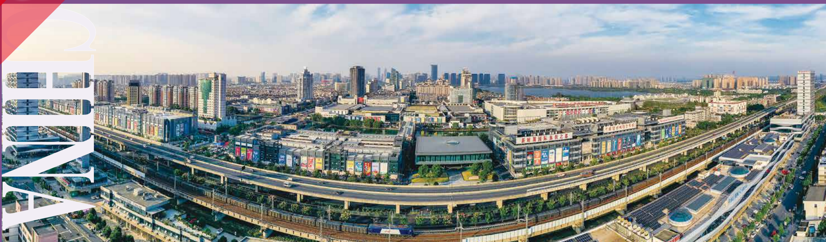
轻纺城为推进中国式现代化柯桥新实践贡献力量。