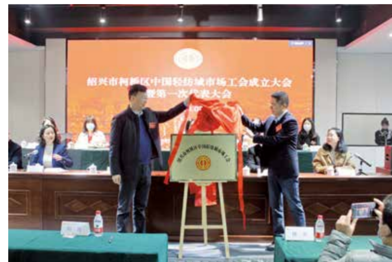
中国轻纺城市场工会揭牌成立。