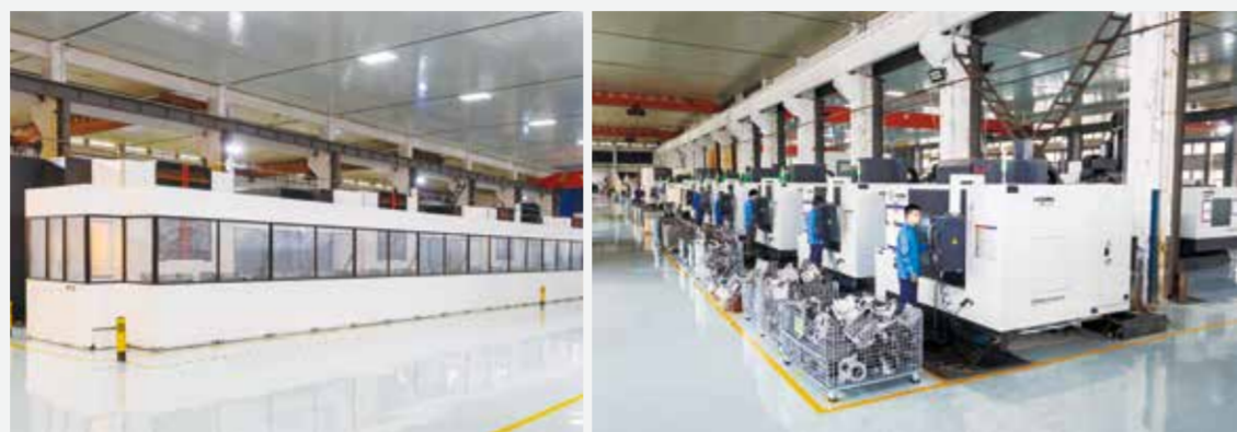
万利纺机作为国家级高新技术企业取得丰硕研发成果。

万利纺机 ：企业产品不仅遍布国内纺织大省，还出口至印度、埃及、土耳其等国家。特别值得一提的是，万利纺机的玻纤织机可适应方格布、网格布、电子布、过滤布、膜布等玻纤产品的织造。2021年，公司生产剑杆织机上千台，其中玻纤织机销量超400多台套，产品