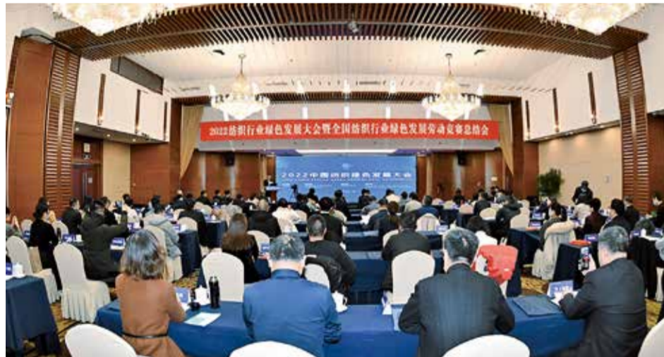
会议为行业未来如何更好地绿色发展提出建议。

2月25日，2022中国纺织绿色发展大会暨全国纺织行业绿色发展劳动竞赛总结会在京召开。作为工业和信息化部纺织服装“优供给促升级”系列活动之一，本次会议以“汇聚行业力量 共促绿色发展”为主题，旨在凝聚行业共识，以满足人民美好生活需要为目标，以节水、节能、减污、降碳为抓手，统筹产业发展与绿色低碳转型，共同推动纺织工业绿色发展再上新台阶。会议回顾了2022年纺织行业绿色发展取得的成效，分析了2023年宏观经济和行业绿色发展新形势，发布了上年度绿色发展劳动竞赛丰硕成果，号召全行业以习近平新时代中国特色社会主义思想为指导，以党的二十大精神为指引，完整、准确、全面贯彻新发展理念，齐众心、汇众力、聚众智，开拓进取，奋发有为，共同开创中国纺织行业的美好未来。