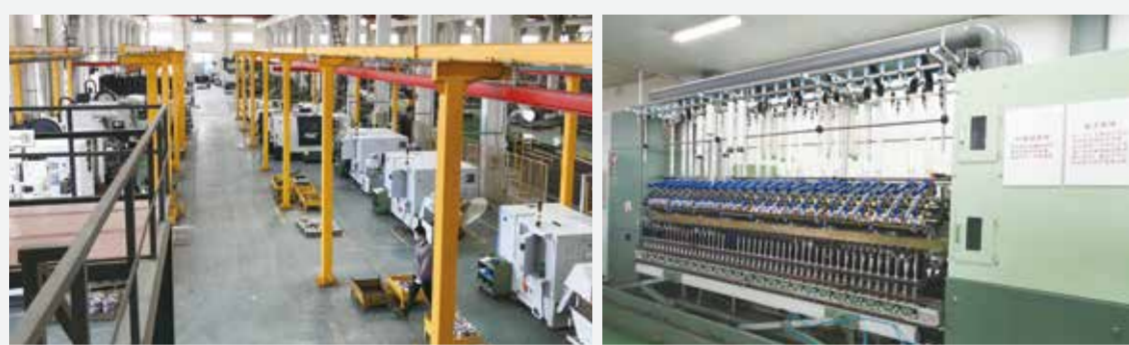
华方科技秉承为客户服务的使命不断自我提升。

华方科技 ：通过内需和外贸双轮驱动，当前，国内纺织百强企业中有80%以上是我们的客户。在海外市场拓展方面，除了传统的东南亚市场外，在“一带一路”国家和地区、南美洲地区、中东地区、非洲地区近几年推广也卓有成效。同时，承担了国内纺织产业向外转移的一些项目。