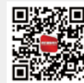
纺织服装周刊 今日头条号