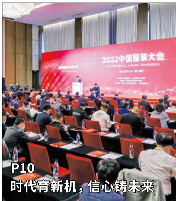
P10 时代育新机, 信心铸未来