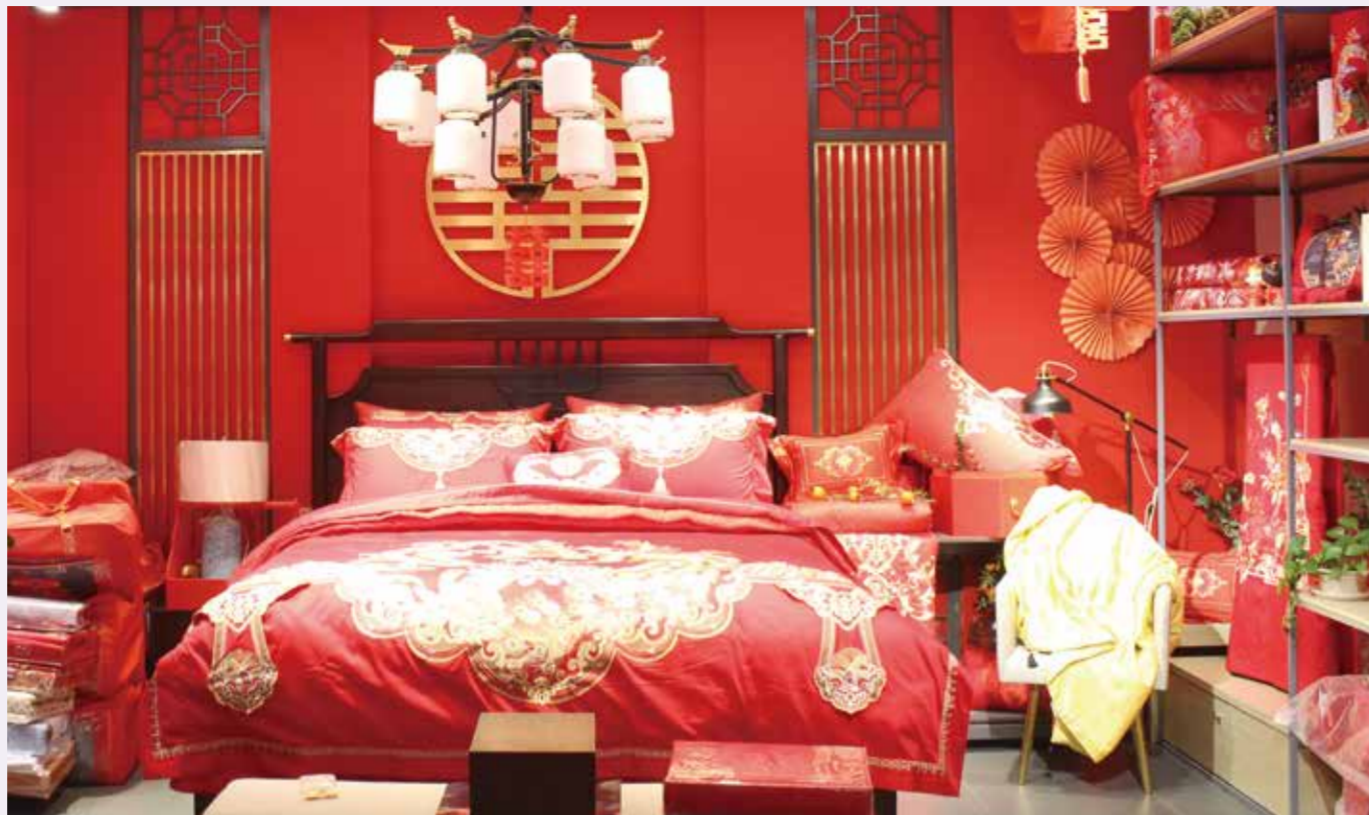
自9月份以来,婚庆类家纺产品走俏中国轻纺城市场,各家纺门店均推出多款婚庆床品。