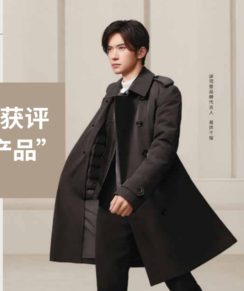
波司登品牌代言人 易烊千玺

通过高级定制制作工艺，将修身、保暖和防护集于一身，在设计、工艺、面料、版型四方面实现了创新和突破：防风防雨抗皱，颠覆传统实现一体化设计，创新分区充绒，亚洲版型更显修身。每一件风衣羽绒服都有超过52个衣片，耗时960个小时，历经300道制作工序才精制而成；采用了通过国际RDS认证的800+高蓬松度大朵鹅绒，加上内里通道布直充工艺结构，充分保证了保暖度。内胆外衣可拆卸，造型自由切换，一衣多穿，轻松驾驭多元场景，开创了羽绒服全新品类。