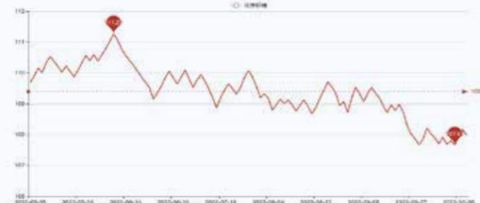
图2 盛泽市场化学纤维价格指数

本周国际油价出现走高。俄乌冲突导致油价飙升60%之后,预计2023年能源价格将下跌11%。全球经济增长放缓可能放大跌幅。日产证券研究部总经理Hirokyu Kikukawa表示,“稳定的美国原油出口提振了对需求的乐观情绪,并吸引了新的买盘,但需求的担忧令市场情绪承压。”报告称,由于欧盟对俄罗斯石油和天然气产品的禁运,以及从12月5日起生效的保险和航运限制,俄罗斯的石油出口可能每天减少多达200万桶。截至10月27日收盘,纽约商品交易所12月交货的轻质原油期货价格上涨1.17美元,收于每桶89.08美元,涨幅为1.33%;12月交货的伦敦布伦特原油期货价格上涨1.27美元,收于每桶96.96美元,涨幅为1.33%。