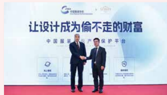
会议期间举办了未来论坛、平行论坛、盛泽时刻等多项活动。