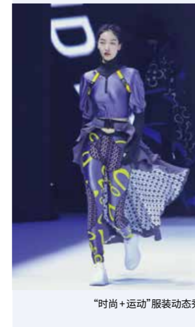
“时尚+运动”服装动态秀。