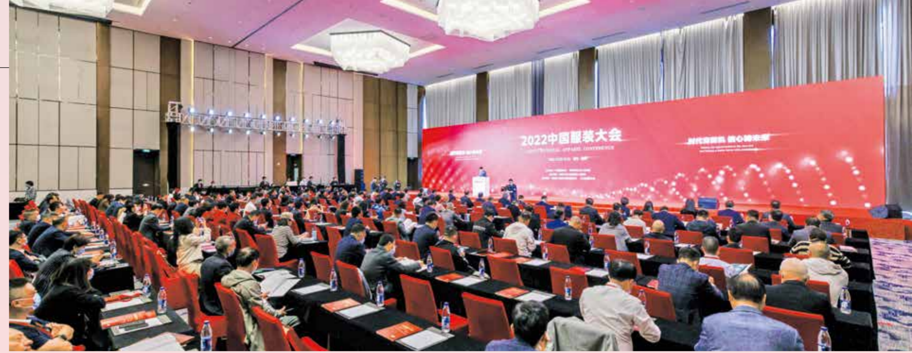
2022 中国服装大会以丰富的活动内容，与服装人共探新时代产业发展的全新路径。

新时期我国服装产业发展将不可避免地面临需求收缩、供给冲击、预期转弱等多重压力与挑战。危机中育新机，变局中开新局。在新的历史时期，我们面临怎样的机遇？我们拥有怎样的信心？我们将谱写怎样的未来？相信这是每一位服装人发出的产业时代之问。