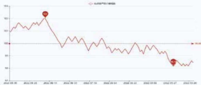
图1 盛泽市场化纤类产品价格指数

据对350家被采价单位反馈的数据监测分析,本周商务部中国·盛泽丝绸化纤指数小幅下降。其中,化纤总指数收盘于98.44点,与上周相比下降了0.17点;化纤面料价格指数小幅回落,收盘于98.53点,与上周相比下降了0.15点;化学纤维价格指数小幅回落,收盘于107.98点,与上周相比下降了0.20点。本周蚕茧丝绸类产品价格指数小幅下降,收盘于107.34点,与上周相比下降了0.28点。