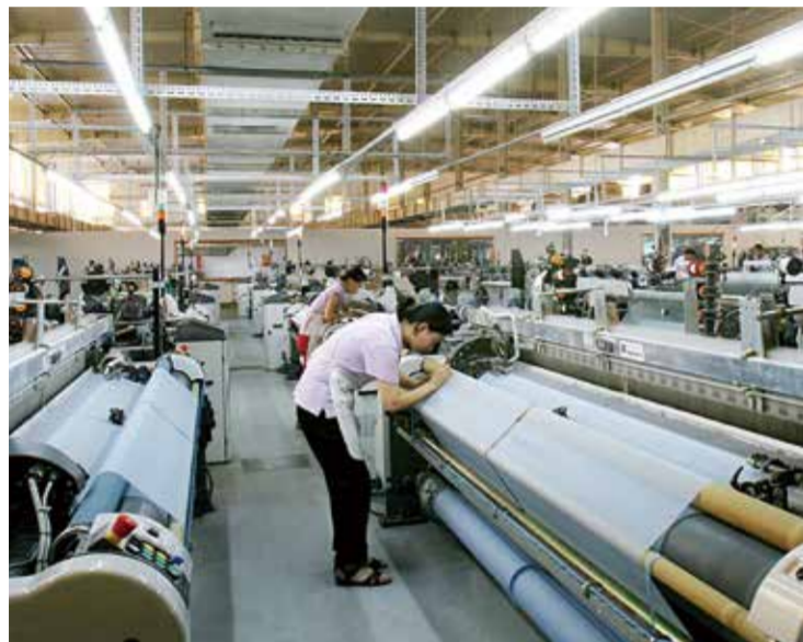
国家六部门明确提出将进一步加大制造业引资力度。

发展。具体是进一步扩大外资流入，稳定外商投资规模，提高利用外资质量，使制造业更深入融入全球产业链供应链。