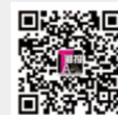
TA 潮报 微信订阅号