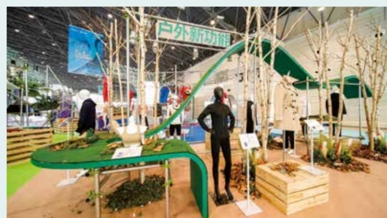
盛泽纺博会全方位向全球展示时尚之都·美丽盛泽高质量发展、现代化建设的最新成果。