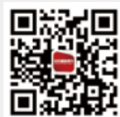
纺织服装周刊 新浪微博