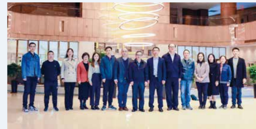
参加评审的专家合影。

10月21日，“纺织之光”2022年度中国纺织工业联合会教师奖和学生奖评审会在大连工业大学召开。中国纺织服装教育学会执行会长、纺织之光科技教育基金会副理事长倪阳生，大连工业大学副校长杜明出席评审会。来自全国15所纺织服装院校的10余位负责“纺织之光”教师奖和学生奖评选工作的教师参加会议，另有10余位教师参加线上会议。