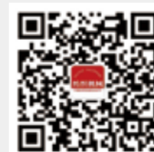
纺织机械 微信订阅号