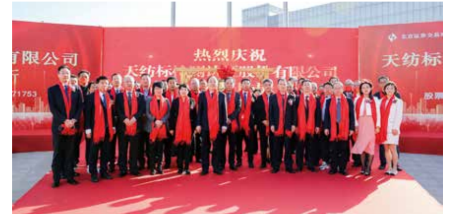
天纺标举行上市庆祝仪式。

作为第三方检测机构，天纺标主要致力于纺织服装领域的检测、标准、认证业务，在纤维含量、色牢度、物理性能、化学性能、微生物、防护性能等方面具有专业的技术能力和丰富经验。天纺标相关负责人曾在采访中谈到，在消费品检验检测方面，尤其是纺织服装、轻工羽绒、防护用品检验检测方面，