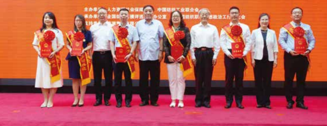
与会领导向获表彰的代表颁发了奖牌和荣誉证书。

“全行业要以此次表彰大会召开为契机，牢牢把握为实现中华民族伟大复兴中国梦而奋斗的时代主题，大力弘扬劳模精神、劳动精神、工匠精神，努力造就一支有理想守信念、懂技术会创新、敢担当讲奉献的宏大的纺织产业工人队伍。”