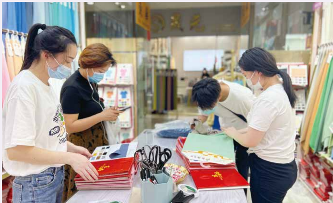
一件T恤所承载的产品创新、工艺创新、模式创新，正是柯桥纺织企业力争上游的小小缩影。