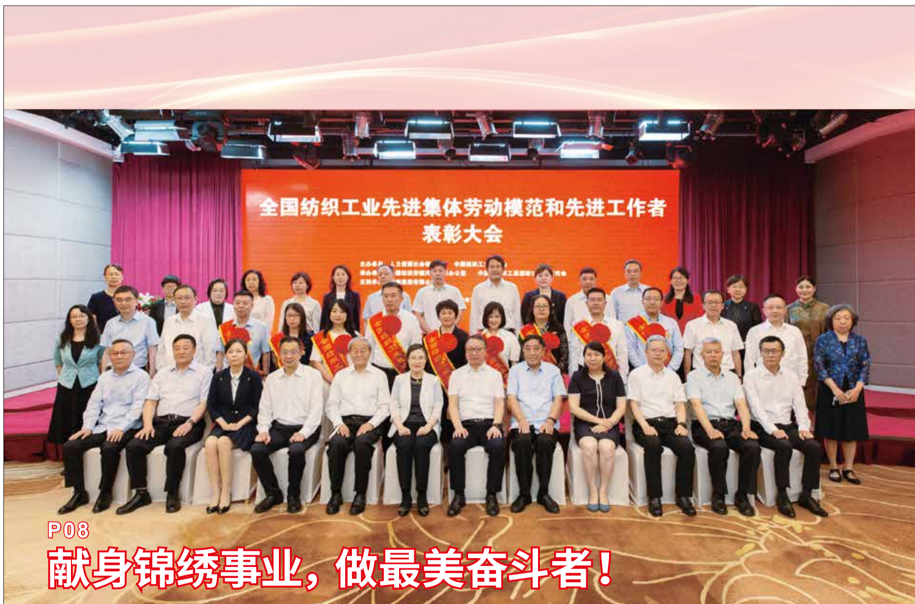
7月12日，全国纺织工业先进集体、劳动模范和先进工作者表彰大会隆重举行。