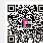
TA 潮报 微信订阅号