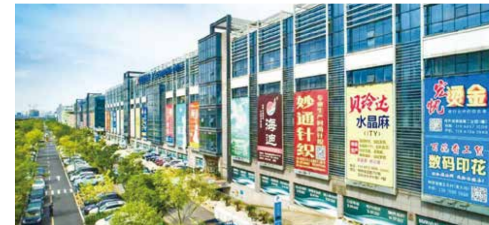
在轻纺城，有很多国潮力量的支持者，他们为“新国货”的崛起贡献了一份力量。