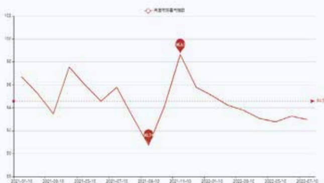
图1 盛泽市场整体景气指数走势图

分析可见，6月是传统淡季，企业的接单气氛回落，上下游整体成交低迷。国内方面，新单下达有限且零散，甚至处于长期观望状态。国外方面，订单开始下至国内，略有放量。原料方面，涤纶长丝随着国际原油价格的下降而重心下移，下游企业购买谨慎，产销一般。