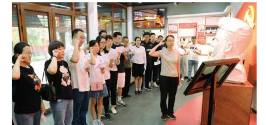
在鲜红的党旗旗下,25名新党员在领誓人的带领下庄严宣誓。

近年来,吉林化纤牢牢把握机遇,加速研发攻关和成果转化,现已形成年产6万吨碳纤维原丝、3万吨碳丝的生产能力,发展成为全国最大的碳纤维生产基地;复材产能达到1万吨,碳纤维设备加工、油剂生产初具规模。