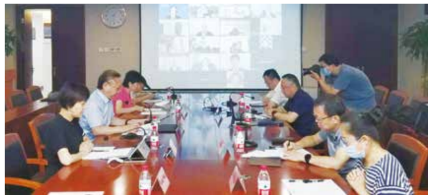
国际纺联指出,全球纺织业要和衷共济,坚持聚焦发展,坚持合作共赢。

关于国际纺联工作,孙瑞哲强调,一要加强沟通协调。办好2022达沃斯年会,围绕“气候变化与可持续的全球纺织价值链”这一主题,努力将开放包容、合作共赢转化为实际行动,为全球发展注入更多纺织力量。二要推动务实合作。用好自身优势和伙伴网络,为行业合作提供更多指导