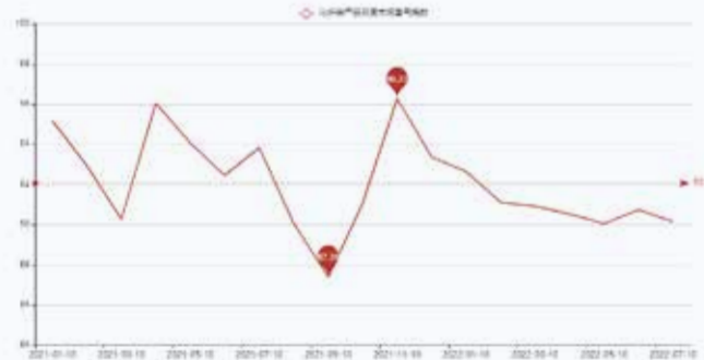
图2 盛泽化纤类产品月度市场景气指数走势图

从二级指标方面来看，6月总体成交气氛较5月有所下降，且几乎所有指标都在下跌。这主要在于6月是传统淡季，市场整体缺乏热销面料且利润低迷，使得工厂生产积极性不高。下半月，国际油价开始下跌，受此影响涤纶长丝价格不断走低，坯布价格也稍有回落，从而导致化纤类景气指数小幅下滑。