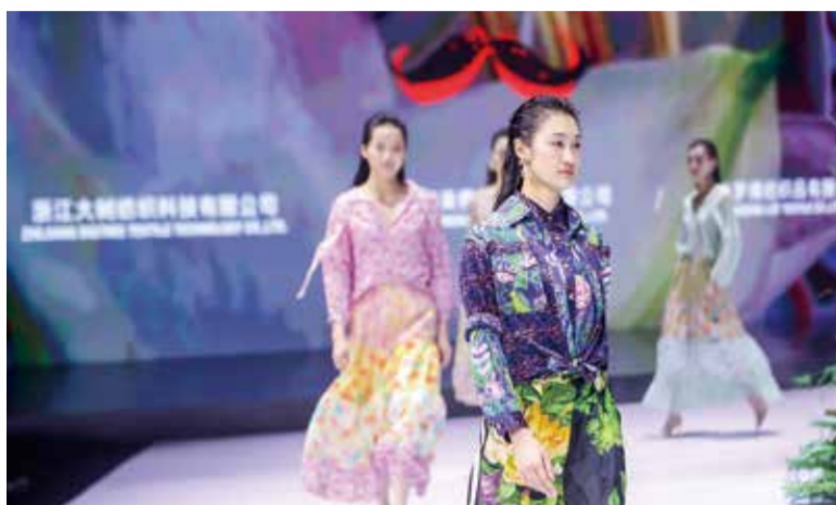
近年来，中国轻纺城持续扩大业界影响力和时尚话语权。

6月27日，中国纺织工业联合会第五次会员代表大会暨五届一次理事会五届一次常务理事会议在线上线下同步召开。