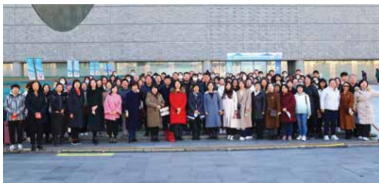
中国纺联200余名干部职工参加了此次活动。