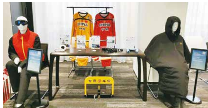
部分服装成果参加助力2022北京冬奥会和冬残奥会“无障碍、便捷智慧生活服务体系构建技术与示范”国家重点科研项目无障碍成果推介展示。

据悉,课题组完成的两项团体标准《冬残奥会运动项目辅助服装设计导则》(T/CAPPD 7-2021)和《肢体残疾人服装用人体测量的尺寸定义与方法》(T/CAPPD 8-2021)已经由中国肢残人协会批准并发布,并于