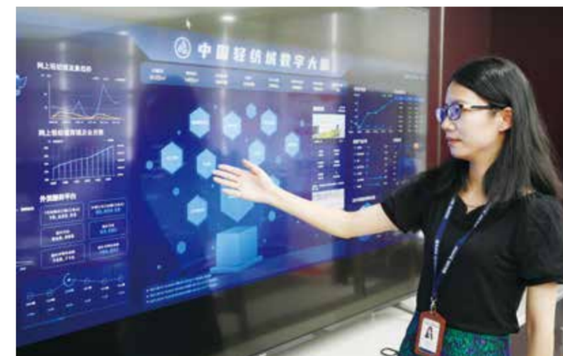
“数字轻纺城”项目的核心定位为数聚生态、智领未来。

下一步，柯桥将继续积极应对挑战，加大培育外贸主体的力度，搭建更多平台，鼓励企业努力开拓市场、创新贸易模式、参与国际合作与竞争，并从政策、金融、服务等方面营造良好的外贸主体成长环境，推动广大企业积极融入国内“大循环”、国内国际“双循环”。