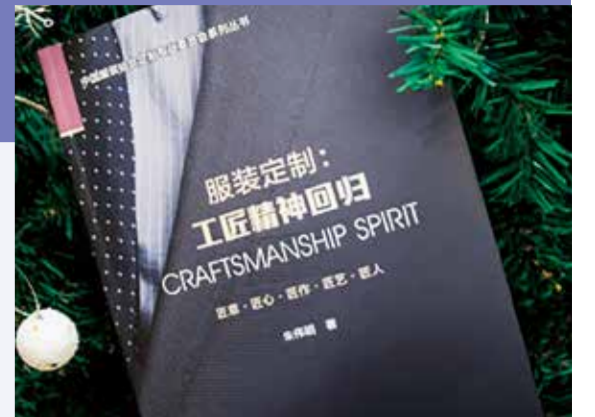
《服装定制：工匠精神回归》一书带来了新的思考与探索。

我国经济发展进入新常态，模仿型排浪式消费阶段基本结束，个性化多样化消费渐成主流，需求呈现易变性、复杂性和模糊性等特点，急需推进供给侧结构性改革。面对需求侧不确定性，我国服装业如何响应消费升级驱动的个性化增量市场，实现供给侧柔性调度，适配个性化需求，成为当前服装业面临的一个重要课题。从消费升级驱动的服装个性化需求变迁为出发点，分析我国服装业结构性失衡与供需双侧错配的现状，构建个性化服装供给侧结构性数字化、柔性化和智能化适配机制，提出服装个性化网络适配制造平台和适配优化对策，指导应用于我国服装定制产业实现新旧动能转换，推动“中国制造