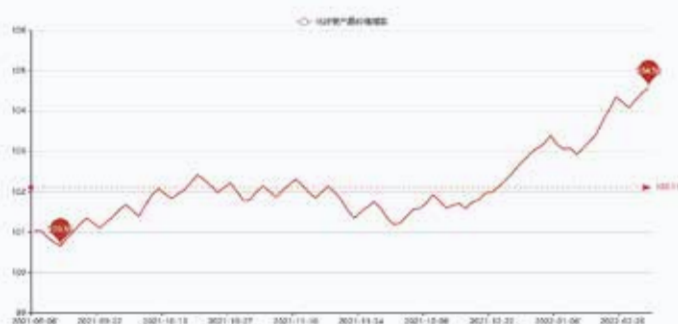
图1 盛泽市场化纤类产品价格指数

据对350家被采价单位反馈的数据监测分析，本周商务部中国·盛泽丝绸化纤指数小幅上升。其中，化纤总指数收盘于104.58点，与上周相比上升了0.33点；化纤面料价格指数小幅上升，收盘于102.13点，与上周相比上升了0.21点；化学纤维价格指数小幅上升，收盘于110.52点，与上周相比上升了0.25点。本周蚕茧丝绸类产品价格指数小幅下降，收盘于107.8点，与上周相比下降了0.05点。