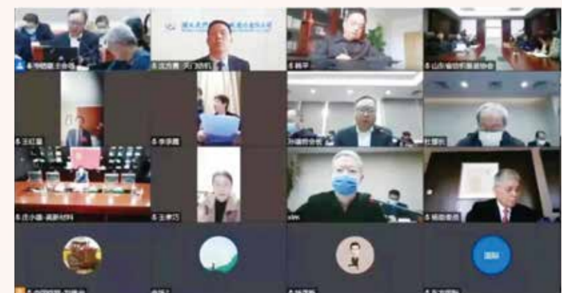
部分代表委员以线上形式参会。

对此，他提出五点建议：一、从需求管理入手，倡导公平竞争，提升国货采购意识，提升本土品牌软实力。二、从源头塑造入手，强化产业链上游“中国面料”品牌培育与时尚话语权塑造。三、从平台建设入手，推动本土纺织工业设计的平台构建与设计价值的市场转换。四、从精神内涵入手，深入弘扬纺织工业文化的时代新精神与发展新典型。五、从文化生态入手，鼓励加强中国纺织时尚的大众消费认知与话语体系。