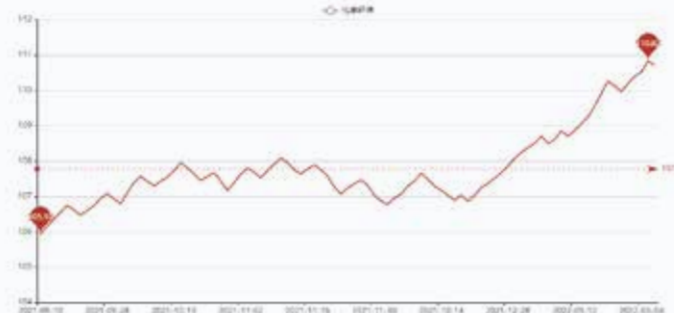
图2 盛泽市场化学纤维价格指数

本周俄罗斯和乌克兰的冲突升级，西方对俄罗斯实施制裁，市场对供应中断担心加剧，国际油价持续暴涨，3月2日布伦特原油期货收于112.93美元/桶，环比涨幅高达7.58%，为2014年6月30日以来的高点。截至3月3日收盘，纽约商品交易所5月交货的轻质原油期货价格为2.93美元，收于每桶107.67美元，跌幅为2.8%；5月交货的伦敦布伦特原油期货价格下跌2.47美元，收于每桶110.46美元，跌幅为2.30%。