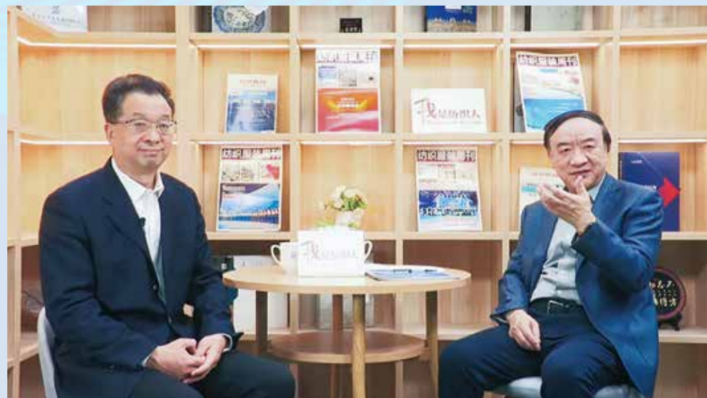
← 中国纺联副会长孙淮滨（右）作为特邀主持人，对话工信部消费品工业司司长何亚琼。

何亚琼 ：确实是这样的，我们要清醒地意识到自身的问题。虽然没有完全卡在别人手中的“卡脖子”的根本性问题，但是确实有一些问题有待解决，比如高端纤维材料，比如行业内应该有更多在世界范围有影响力的品牌，我国纺织需要再创造出更多能引领全世界、在全世界受欢迎的产品，这是我们的一个短板。