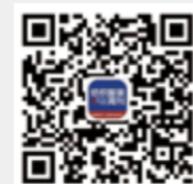
纺织服装周刊 微信订阅号