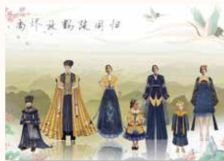
《尚焜放鹤疏同归》王立浩