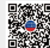
纺织服装周刊 微信视频号