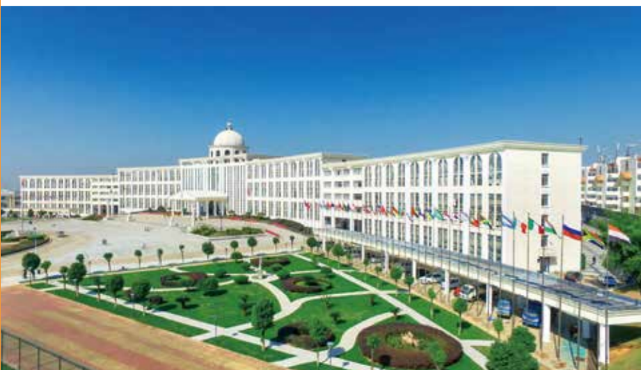
江西服装学院校园一角。

办校30年来,幸遇国家兴盛富强之发展期,学校全面贯彻落实党和国家的教育方针,全面落实国家和江西省中长期教育改革和发展规划纲要,坚持走以质量提升为核心的内涵式发展道路,牢固树立创新创业、转型发展的理念,围绕立德树人的根本任务,加快推进教育现代化,深化教育综合改革,推进“放管服”,提升办学实力。