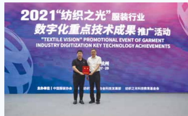
会上,纺织之光科技教育基金会向捐赠单位中国服装科创研究院颁发捐赠证书。

7月29日,由中国服装协会、中国纺织工业联合会科技发展部、纺织之光科技教育基金会共同主办的“纺织之光”服装行业数字化重点技术成果推广活动在浙江省杭州市举办。会议就数字化营销、智能穿戴、三维仿真、柔性化生产、数字化供应链等科技成果进行了交流。