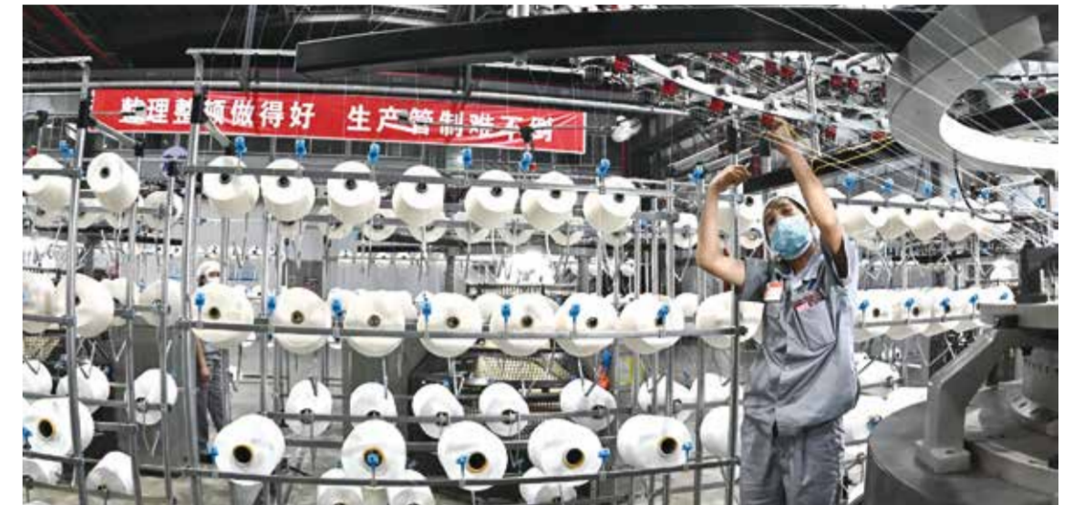
上半年纺织行业经济运行持续稳定恢复,为全年实现平稳运行打下了良好基础。

在全球疫情不断反复的形势下,我国出口企业的应对能力日渐增强,展现了良好的抗风险能力,纺织品服装出口保持良好增长。中国海关快报数据显示,2021年上半年我国纺织品服装合计出口金额为1400.9亿美元,同比增长12.1%,