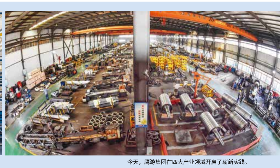
今天，鹰游集团在四大产业领域开启了崭新实践。