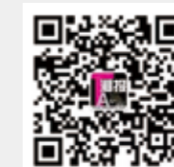
TA 潮报 微信订阅号