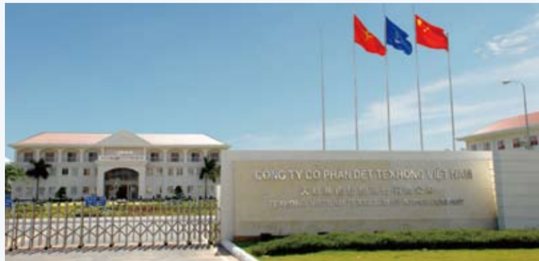
迄今为止，天虹集团深耕越南市场已经十余年。

“一带一路”建设给中国企业“走出去”带来更多的机遇。2017年11月9日，在对越南社会主义共和国进行国事访问前夕，中共中央总书记、国家主席习近平在越南《人民报》发表题为《开创中越友好新局面》的署名文章，文章中特别指出：