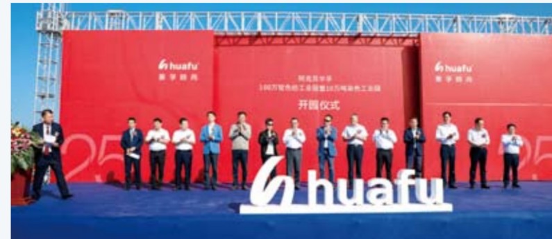
开业仪式现场云集了来自行业协会、地方政府及企业的领导嘉宾，工业园受到广泛关注。

2018年4月13日，华孚时尚股份有限公司迎来25周年庆典；8月25日，阿克苏华孚100万锭色纺工业园暨10万吨染色工业园举行了开业仪式。