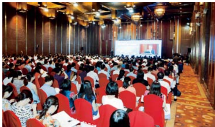
2013年举行了首次中国纺织业“走出去”大会。

为了让企业“走出去”走得更加稳健，从2013年开始，中国纺织工业联合会举办了3届中国纺织业“走出去”大会，邀请国家相关政府部门、全纺织产业链骨干企业、重点国别投资促进机构、国内外智库共同参与，共同分享“走出去”经验，展望纺织业未来发展趋势。