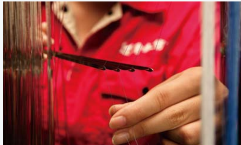
鲁泰通过国际化布局，不断提升综合竞争力。

利润总额翻一番，再造一个鲁泰，成为世界一流知名企业”的发展目标，以“盘活存量、寻找增量、做强实业、适度运作”为发展思路，大力实施“提质增效”和“全面国际化”战略，积极拓展产业结构，实现企业健康稳定持续发展。目前，鲁泰正积极探索多元化发展道路，着眼做“大纺织”、“超纺织”，基于纺织，超越纺织。