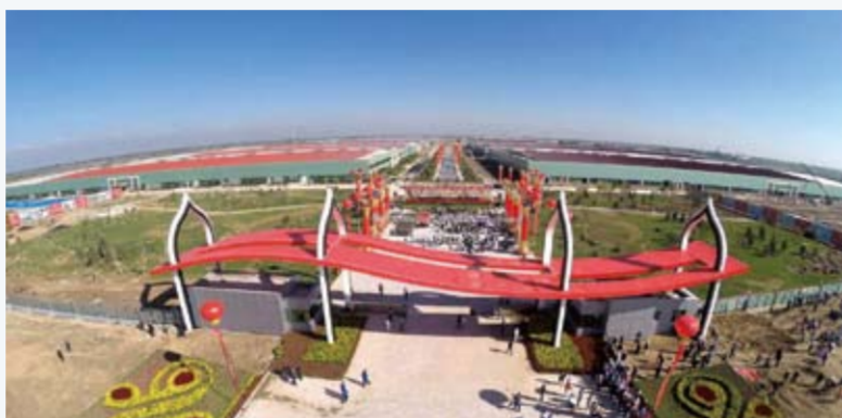
如意通过并购重组，打通了上下游产业链。

如意还相继收购了印度 GWA 毛纺公司、英国哈里斯花呢公司、英国泰勒毛纺公司、新西兰 WSI 毛条公司，这使得如意拥有了发达国家的先进制造技术和设计资源。在“一带一路”产业带上，如意集团形成了一条完整的毛纺产业链，从羊毛开始，到纱线、面料、服装。