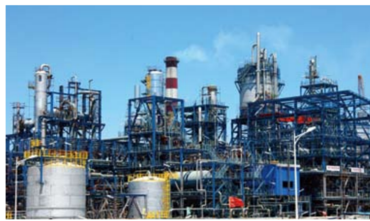
恒逸集团实现了“跨地区、跨行业、跨所有制、跨国界”的四大发展跨越。

据了解，恒逸石化“一带一路”公司债券募集资金全部用于公司在文莱的 PMB 石油化工项目。该项目是首批被列入国家“一带一路”项目库的重点建设项目，恒逸石化属于《通知》明确的第三类“一带一路”债券发行主体。