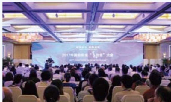
纺织业新一轮“走出去”，不仅仅是简单的产能转移，更重要的是增量“走出去”。

我国纺织产业可通过国际布局实现产业链的跨国整合，实现产业全球价值链的地位提升，实现以全球资源对接全球市场，培育一批以中国本土为根基的跨国制造企业和时尚集团，同时带动一批发展中国家实现共赢发展，是实现产业在品牌、科技、人才与可持续等维度跻身强国的应有之义。