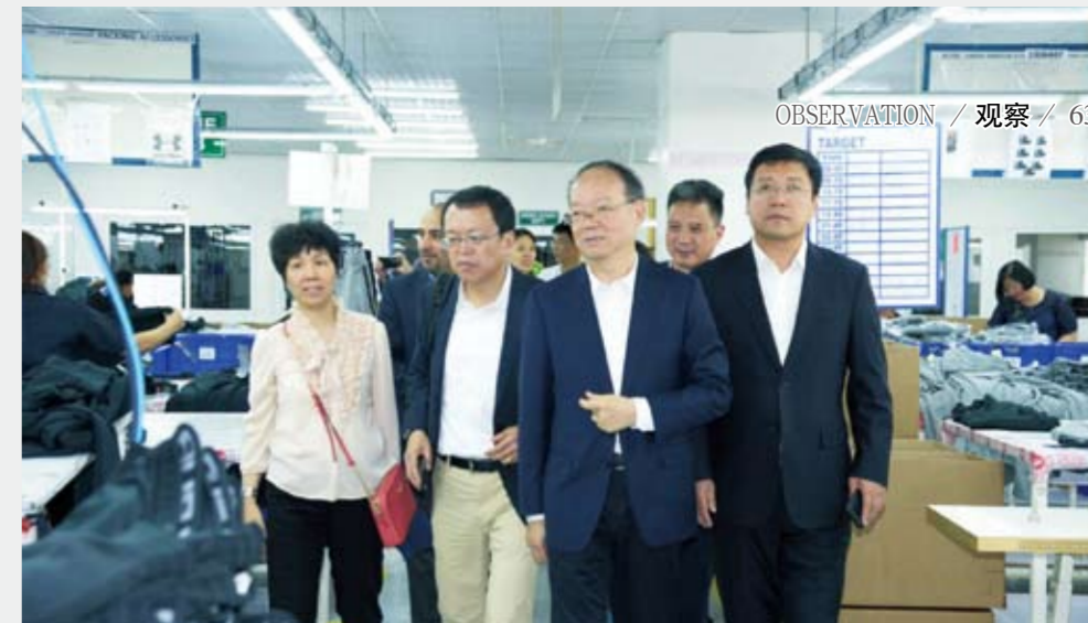
中纺联党委书记高勇带队出访约旦。

第三季中意服装企业深度对接活动走访意大利维琴察与比埃拉，参观了当地知名企业及设计师工作室，并在两地各举办了一场中意服装企业对口洽谈会，吸引了40余家意大利服装服饰高端制造企业、品牌前来交流。